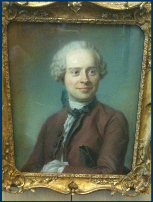
Жан Лерон Д'Аламбер (1717-1783)