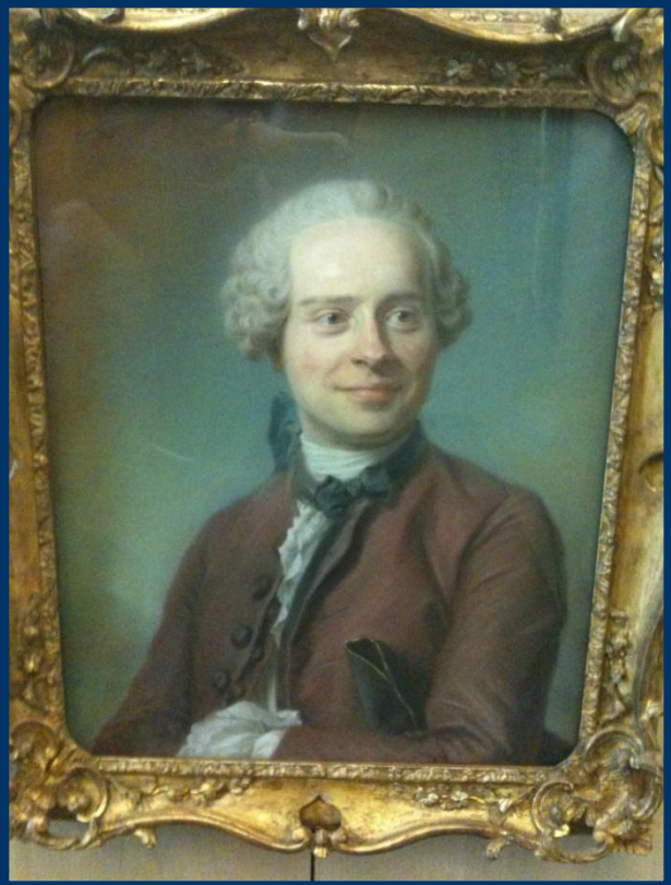
Жан Лерон Д'Аламбер (1717-1783)