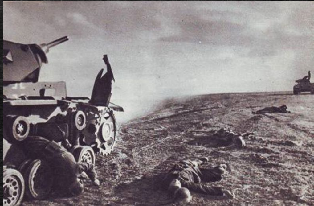
Атака немецких танков отбита