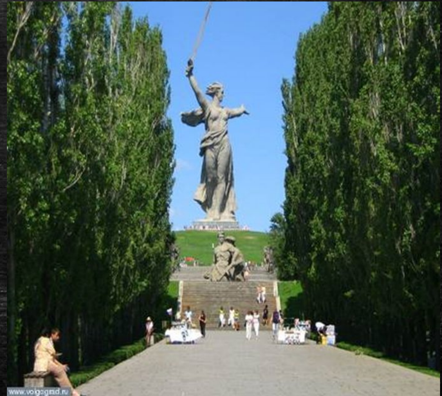
Мемориальный комплекс на Мамаевом кургане (современный вид)

Бои за курган начались 14 сентября 1942 года.