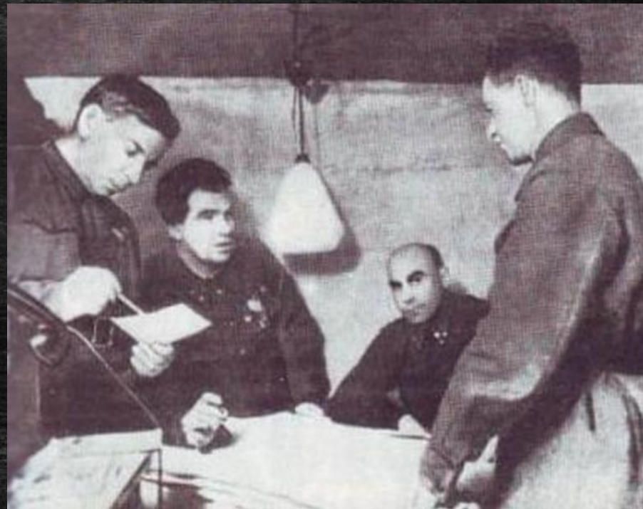
В штабе 62-й армии: Н.И.Крылов, В.И. Чуйков, К.А.Гуров, А.И.Родимцев

17 июля 1942 года передовые части фашистской группы армий «Б» в большой излучине Дона встретились с войсками Сталинградского фронта. Началась Сталинградская битва.