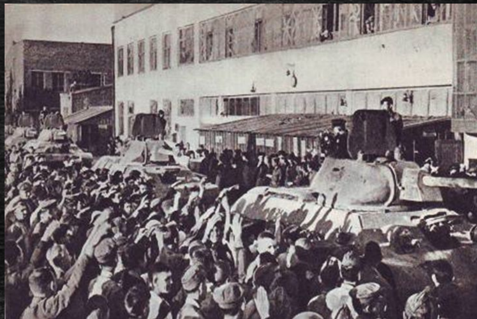
Танки с завода уходят на фронт

Сталинградский тракторный приступил к выпуску танковых моторов, артиллерийских тягачей и средних танков Т-34.