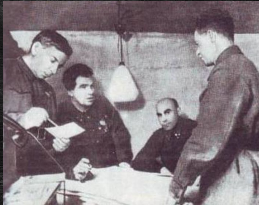
В штабе 62-й армии: Н.И.Крылов, В.И. Чуйков, К.А.Гуров, А.И.Родимцев

17 июля 1942 года передовые части фашистской группы армий «Б» в большой излучине Дона встретились с войсками Сталинградского фронта. Началась Сталинградская битва.