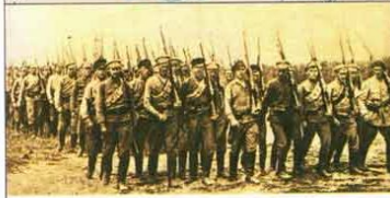
Красная армия (1918 г.)