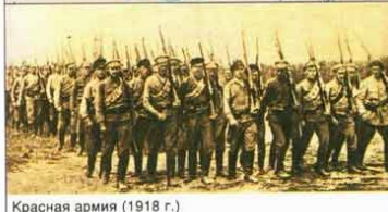
Красная армия (1918 г.)