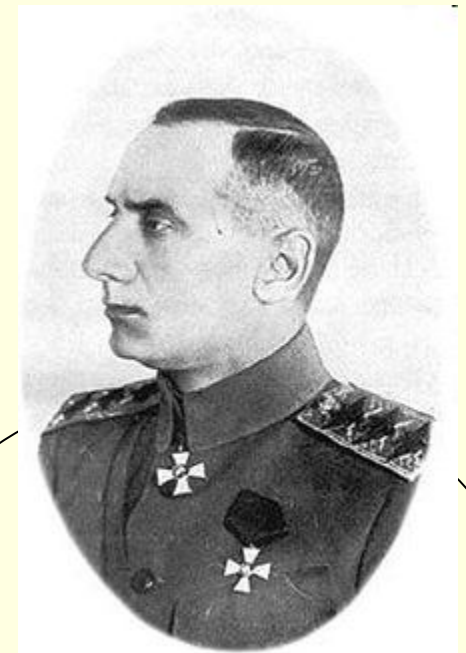
А. В. Колчак – верховный правитель России