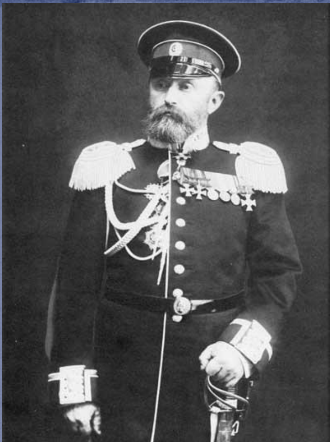
Контр-адмирал В.Ф. Руднов