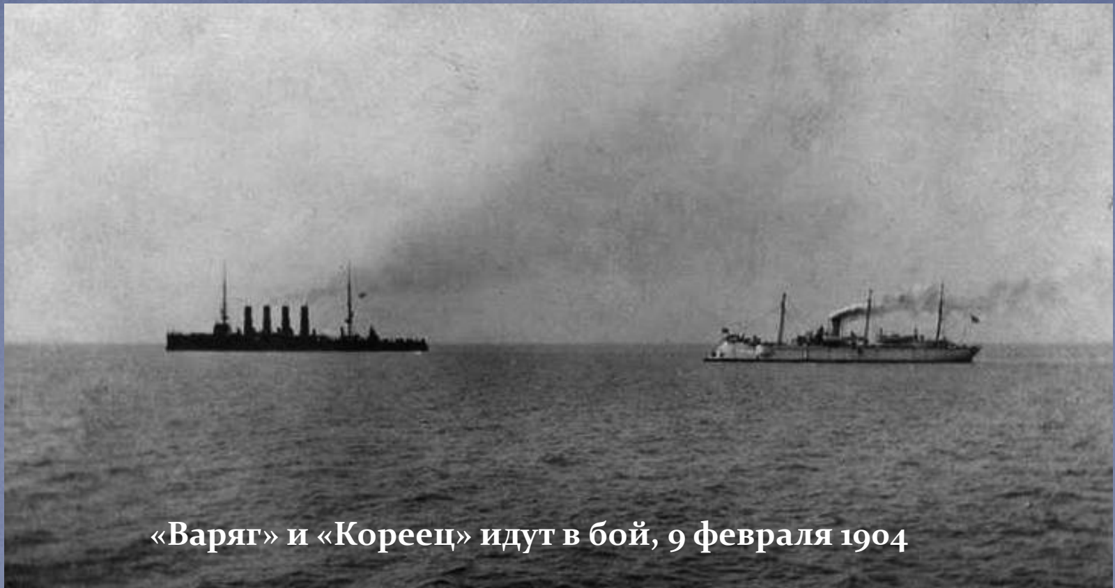
«Варяг» и «Кореец» идут в бой, 9 февраля 1904

В первый день русско-японской войны «Варяг» и канонерская лодка «Кореец» были заблокированы в Чемульпо (Корея). При попытке прорвать блокаду они были вынуждены маневрировать в узком и мелководном фарватере, ведя бой с шестью японскими крейсерами.