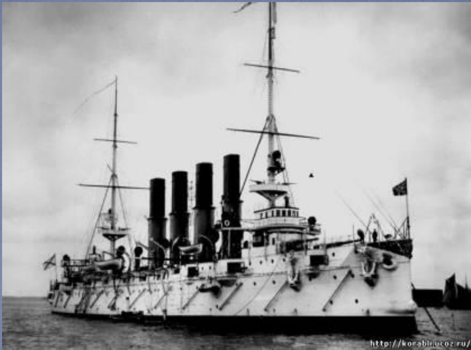
Бронепалубный крейсер «Варяг» Первого ранга