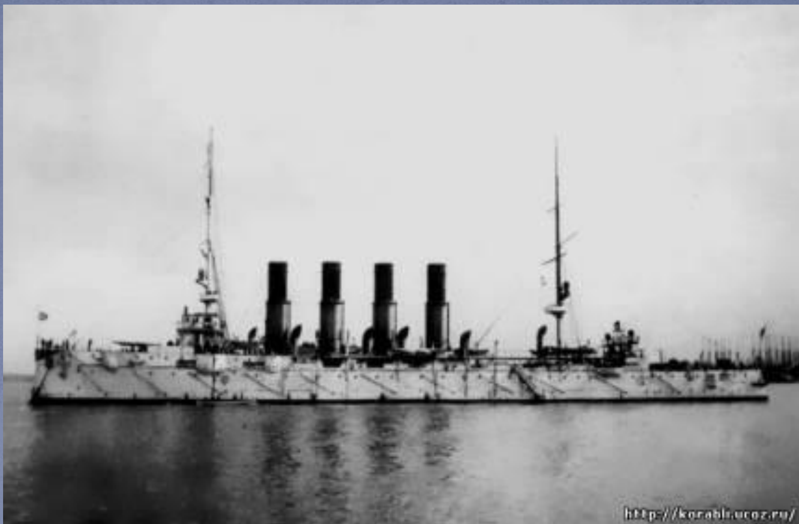
«Варяг» перед выходом в Россию из Филадельфии, 1901 год