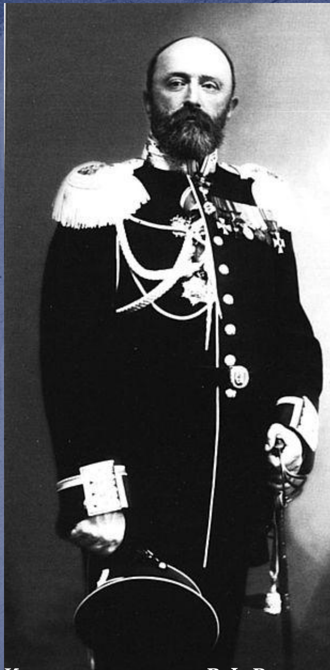
Капитан 1-го ранга В.Ф. Руднев

В декабре 1902 года вышел приказ по Морскому министерству, которым В.Ф. Руднев был назначен командиром крейсера «Варяг», принявшего бой у Чемульпо в 1904 году.