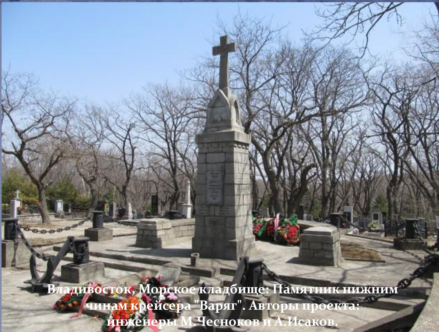
Владивосток, Морское кладбище: Памятник нижним чинам крейсера "Варяг". Авторы проекта: инженеры М.Чесноков и А.Исаков.

Умершие в Чемульпо от ран члены экипажа «Варяг» были перезахоронены в 1911 году на Морском кладбище Владивостока.