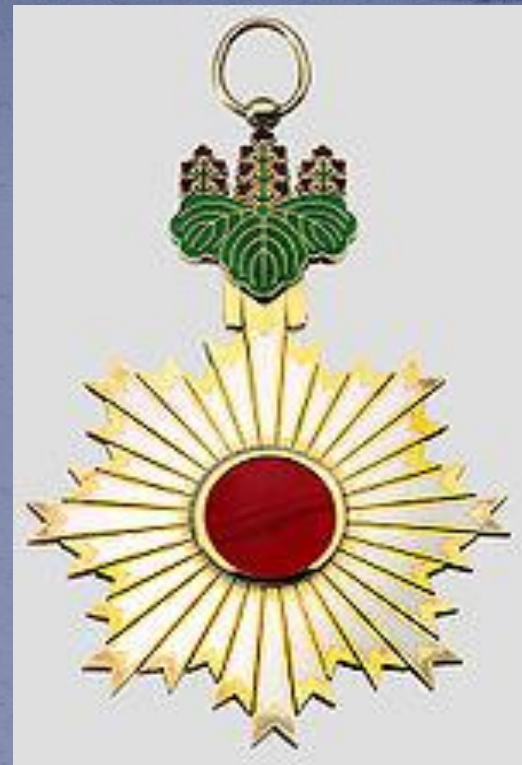
Японский орден Восходящего Солнца

В 1907 году Руднев был награждён японским орденом Восходящего солнца II степени.