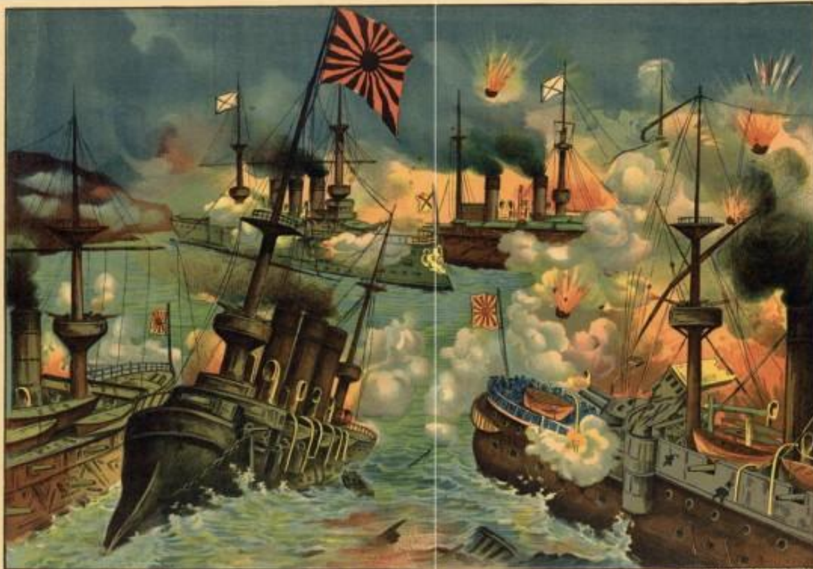
Безприм'рний бій «ВАРЯГ» і «КОРЕЙЦ» під Чемульпо.

Ще влітку 1904 року в Японії вийшло повідомлення про перемогу японських кораблів «Корейц», «Корейц», «Корейц», «Корейц», «Корейц» і «Корейц» над російськими кораблями «Варяг» і «Корейц» під Чемульпо. Цей бій став одним з найбільш героїчних в історії морської війни. Російські кораблі «Варяг» і «Корейц» вийшли з порту Чемульпо, щоб допомогти російським військам. Вони вийшли в море 28 грудня 1904 року. Японські кораблі «Корейц» і «Корейц» зустріли російські кораблі в Чемульпо. Бій тривав до 10 грудня 1904 року. Російські кораблі були знищені, а японські кораблі захоплені. Цей бій став одним з найбільш героїчних в історії морської війни.