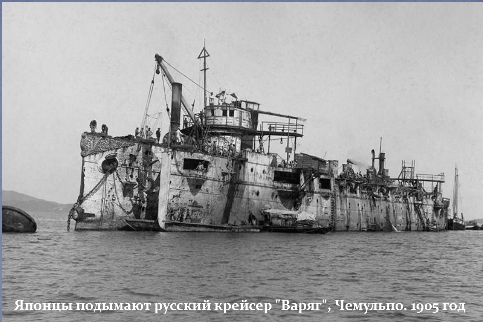
Японцы поднимают русский крейсер "Варяг", Чемульпо. 1905 год

Поднятый в 1905 году японцами «Варяг» был назван «Сойя» и служил в японском флоте до 1916 года.