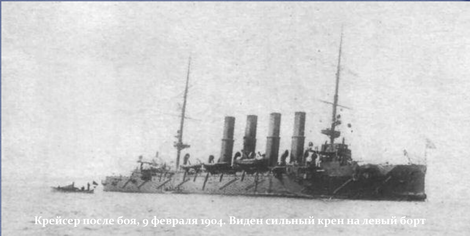
Крейсер после боя, 9 февраля 1904. Виден сильный крен на левый борт

Из-за полученных тяжёлых повреждений «Варяга», русские корабли вернулись на рейд в Чемульпо. «Кореец» был взорван, «Варяг» затоплен