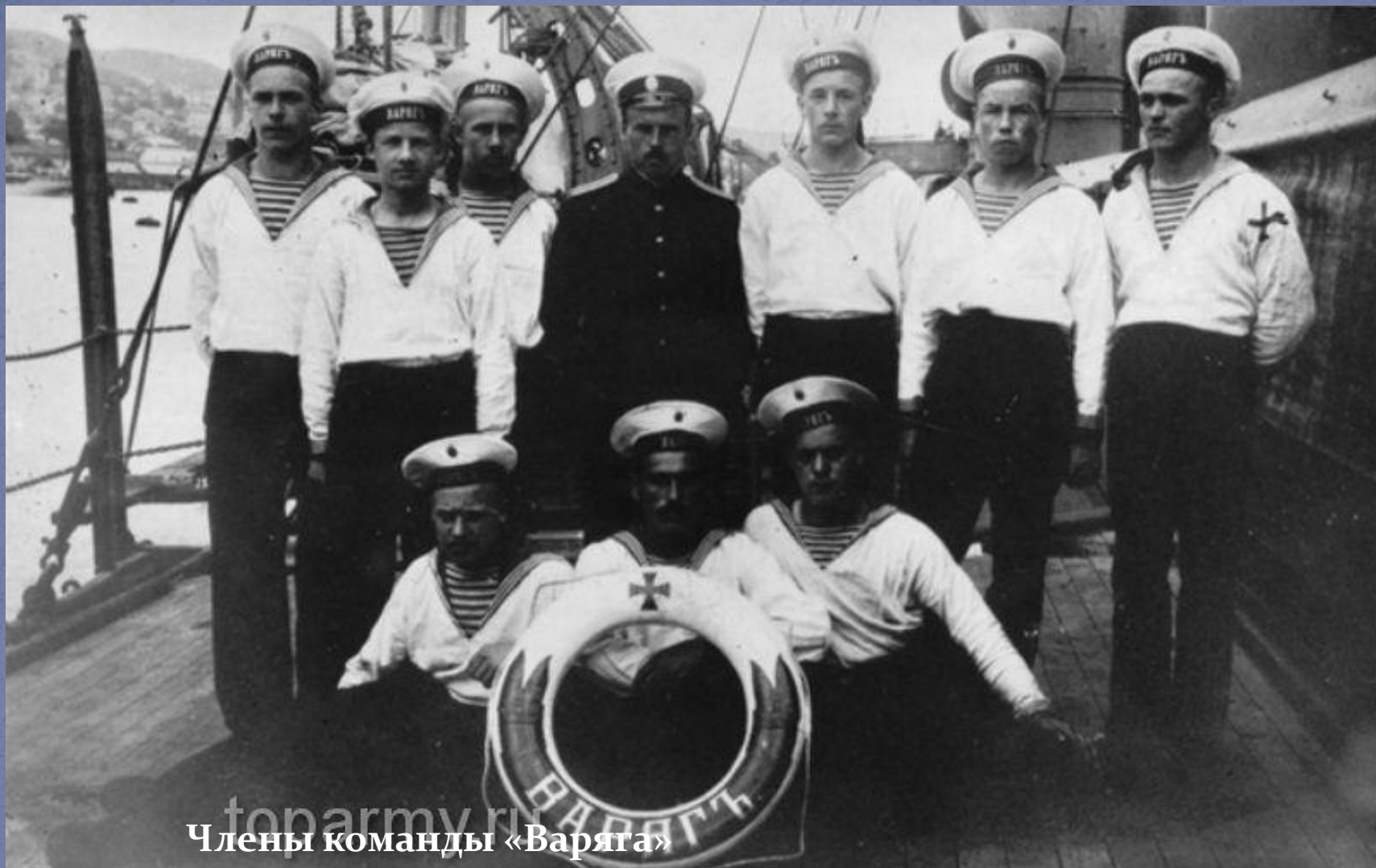
Члены команды «Варяга»