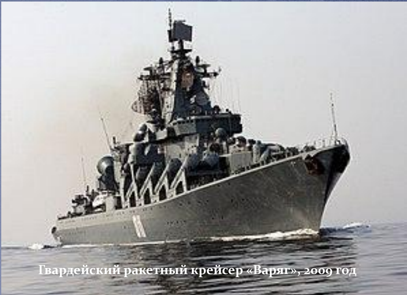
Гвардейский ракетный крейсер «Варяг», 2009 год

19 апреля 1990 года «Варяг» был разоружен, исключён из состава Военно-морского флота и 21 мая 1991 года расформирован. Почётное имя «Варяг» было передано авианесущему крейсеру