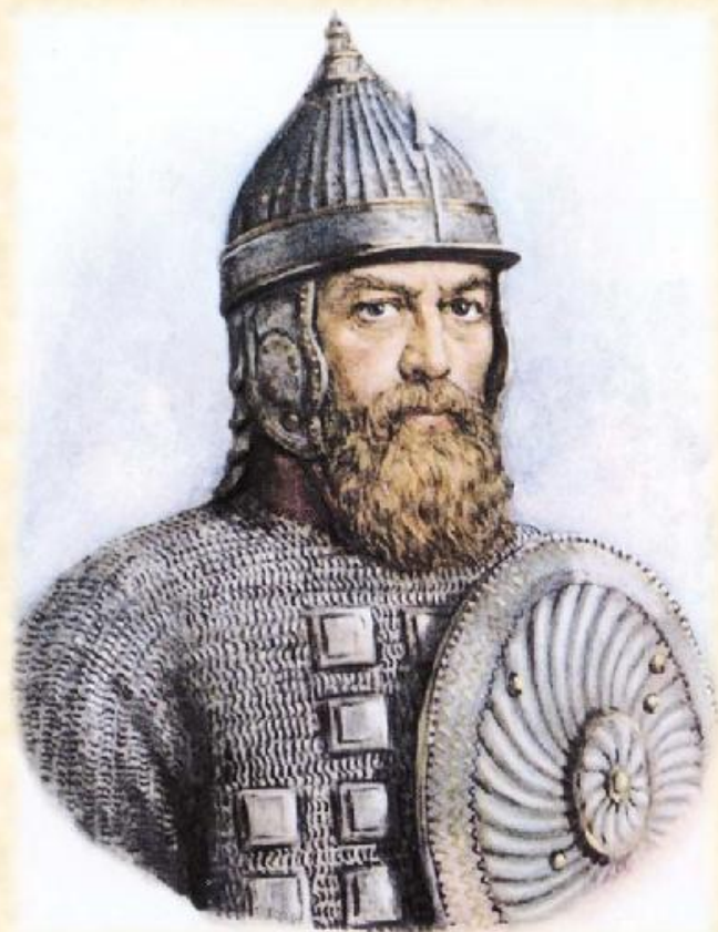
Князь Дмитрий Пожарский (1578-1641)