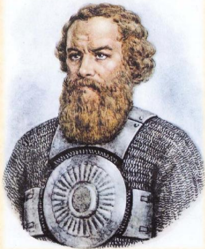
Кузьма Минин (1578—1642)