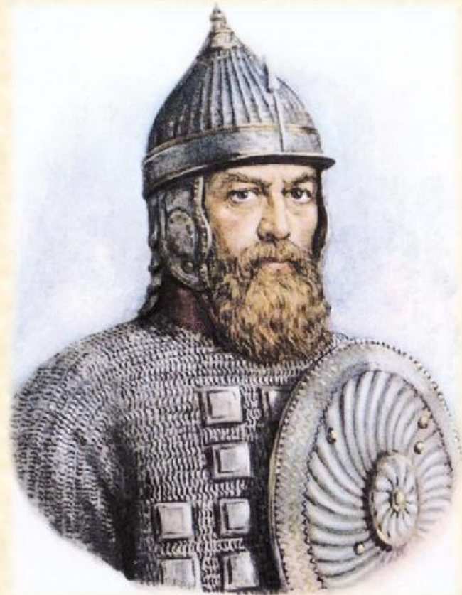
Князь Дмитрий Пожарский (1578-1641)