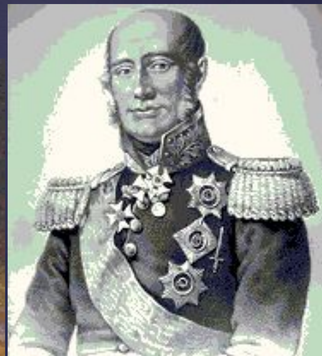
Барклай де Толли