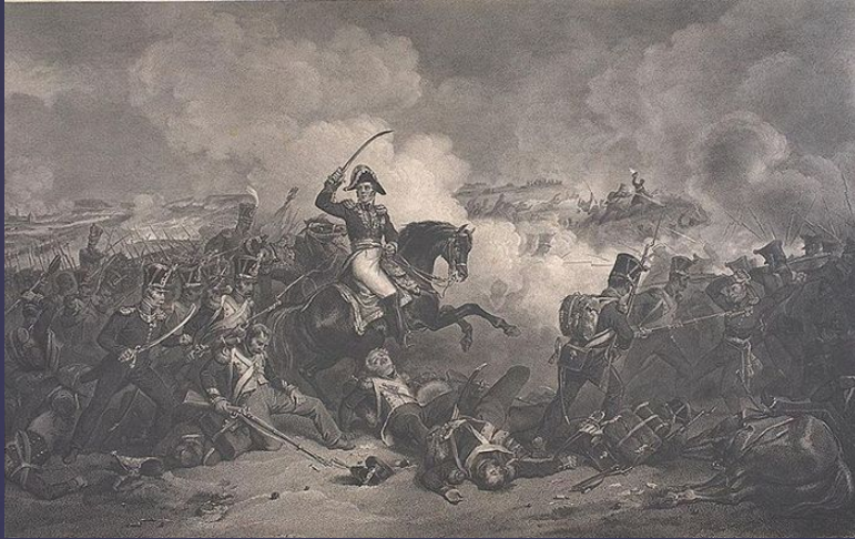
Атака маршала Нея