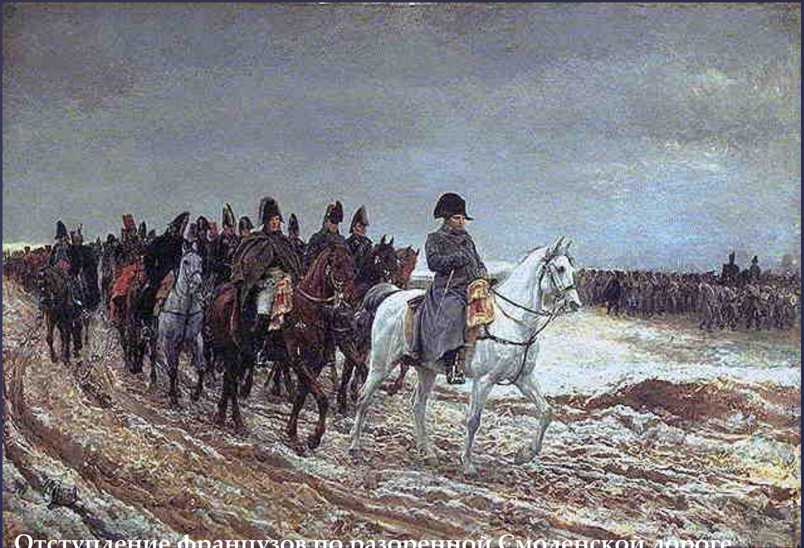
Отступление французов по разоренной Смоленской дороге