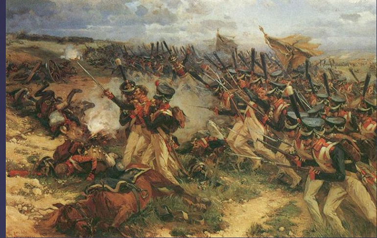
Атака лейб-гвардии Литовского полка из 5-го пехотного корпуса.

Русский историк Н. П. Михневич сообщил такой отзыв Наполеона о сражении: