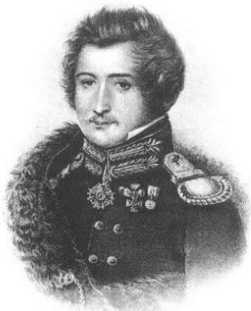
С.И.Муравьев - Апостол