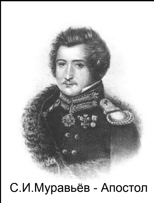
С.И.Муравьев - Апостол