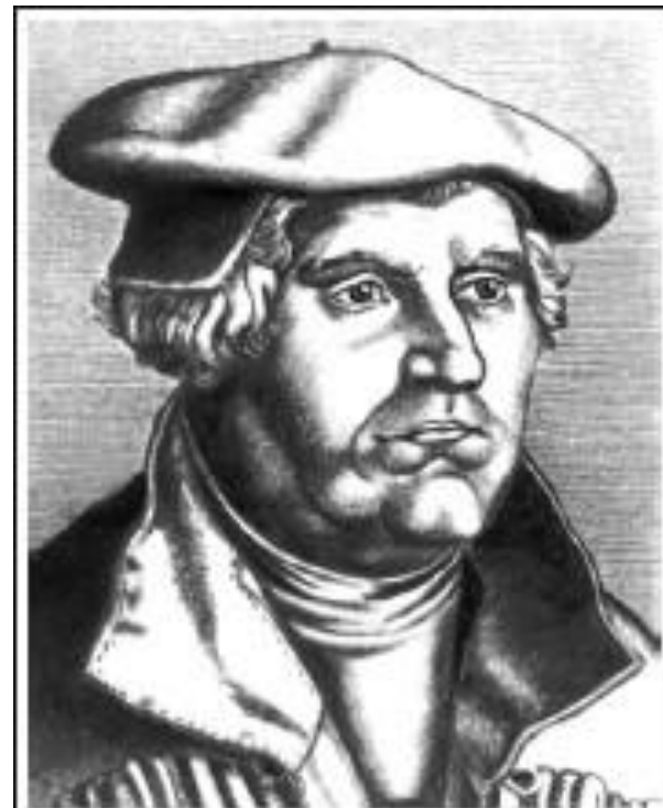
Мартин Лютер 1483 – 1546