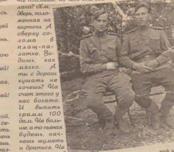
Это в образе