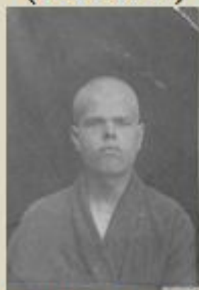
Май 1943 года. Госпиталь