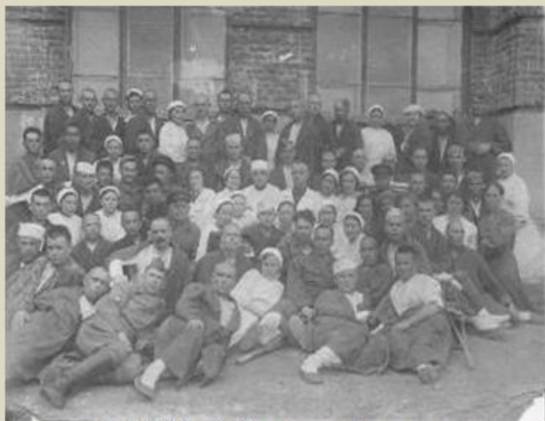
Май 1943 года. Брединский госпиталь