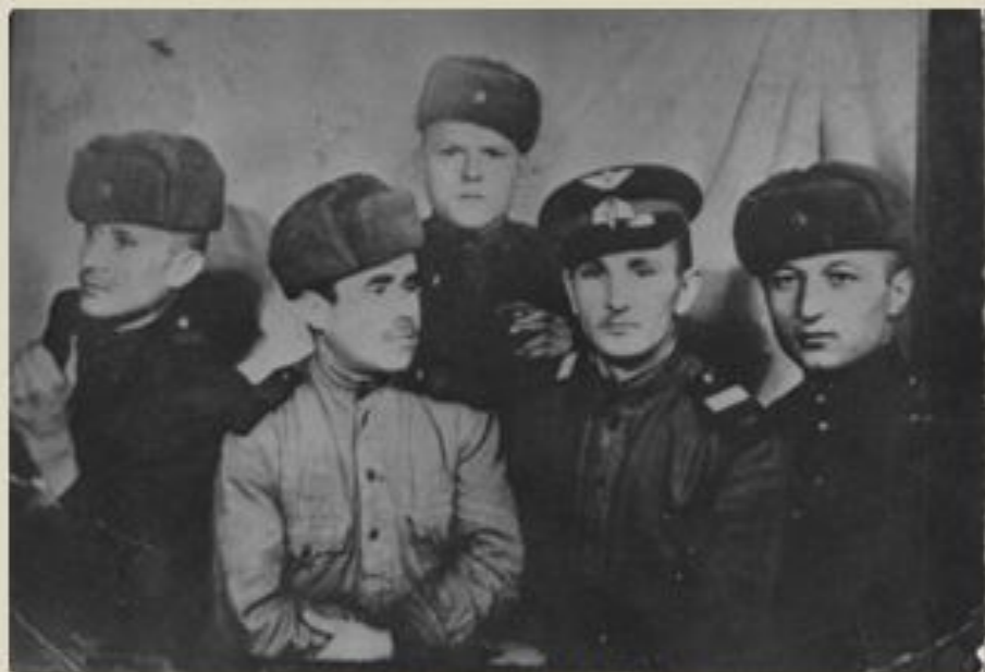
На фотографии в центре

Краткие сведения о прохождении военной службы