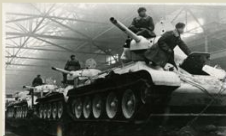
Челябинск. Тракторный завод (военное время)

...Брединцы внесли вклад в создание танковой колонны «Челябинские колхозники» (55 танков), принявшей участие в Сталинградской битве