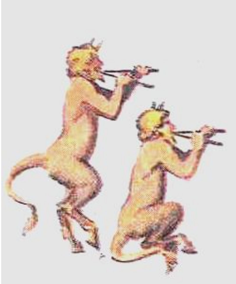
САТИРЫ – демоны плодородия