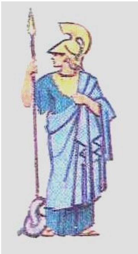
Афина – богиня мудрости и справедливой войны