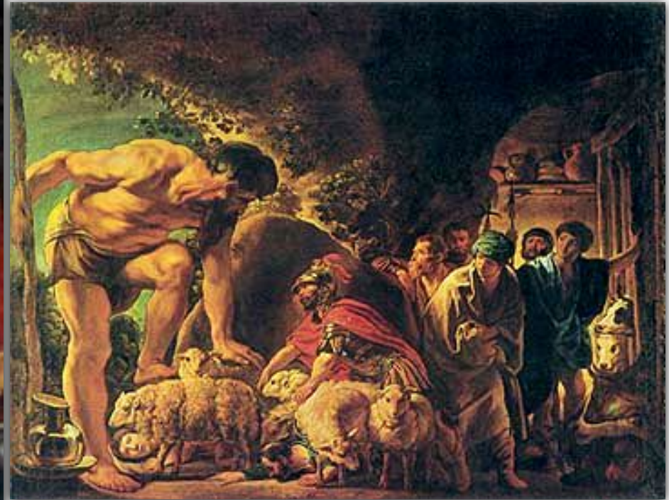
Одиссей и Полифем