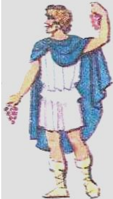
Дионис – бог виноградарства, виноделия