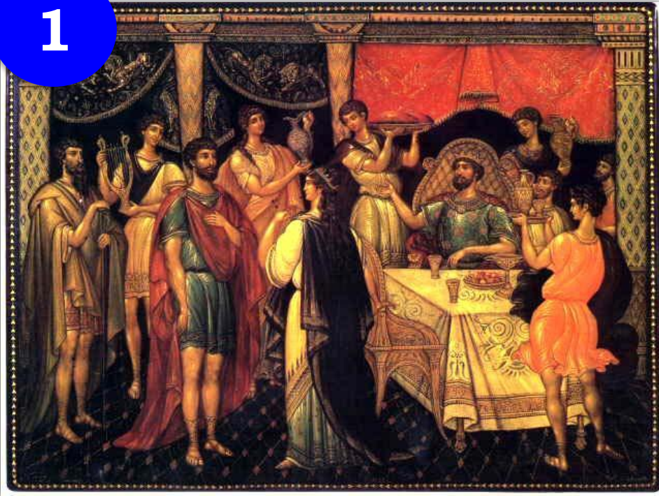
Одиссей у царя Алкиноя