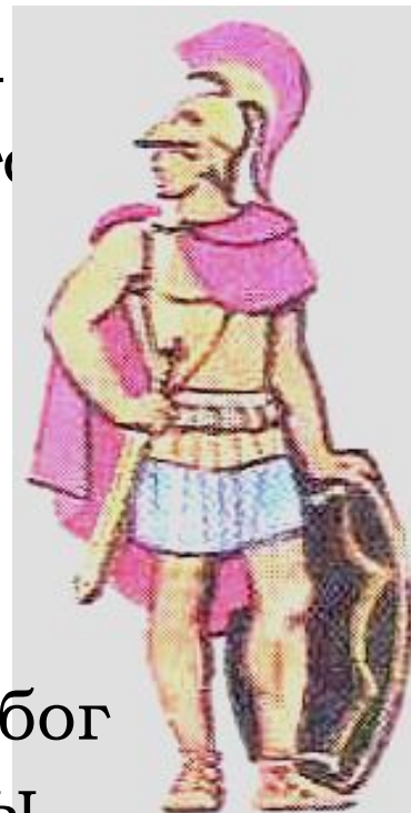
Арес – бог войны