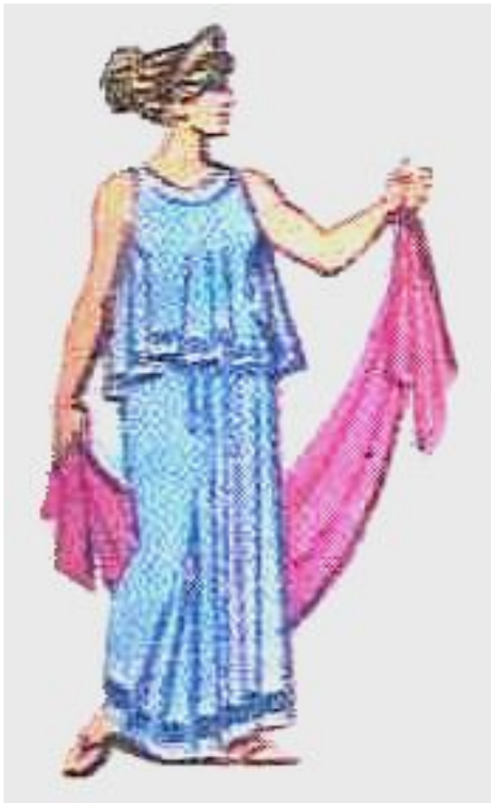
Гера – верховная богиня, жена Зевса