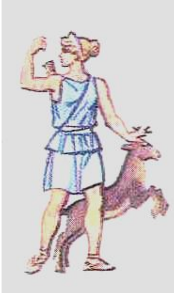
Артемида – богиня охоты, гор и лесов