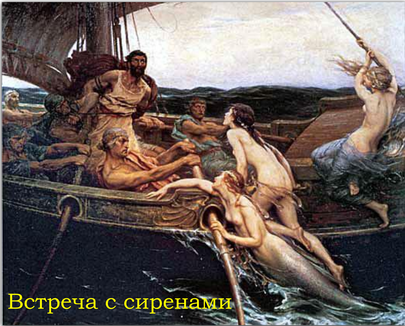
Встреча с сиренами