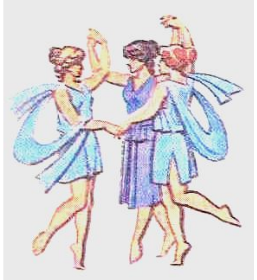
НИМФЫ – божества природы, её живительных и плодородных сил