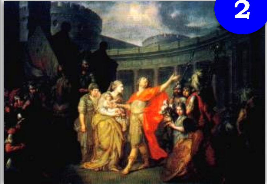
А.Лосенко. Прощание Гектора с Андромахой.