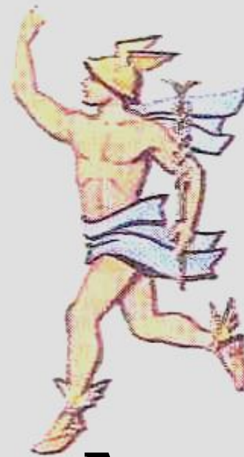
Гермес – вестник богов