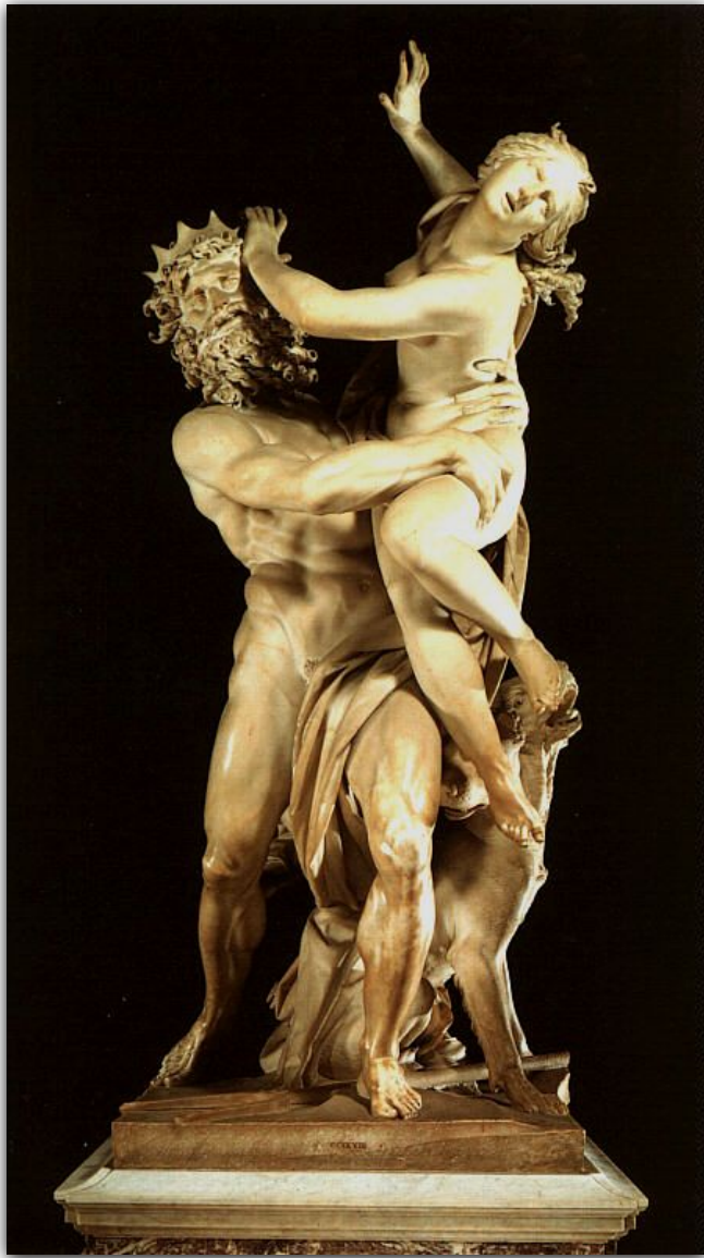
Аид похищает Персефону.

Прочитать миф о Деметре и Персефоне (стр.136-137)