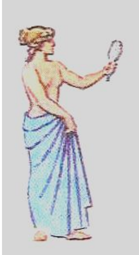
Афродита – богиня любви и красоты