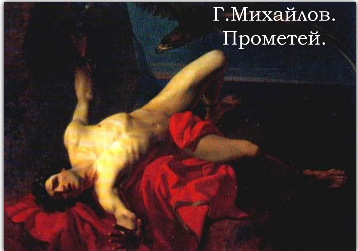
Г. Михайлов. Прометей.