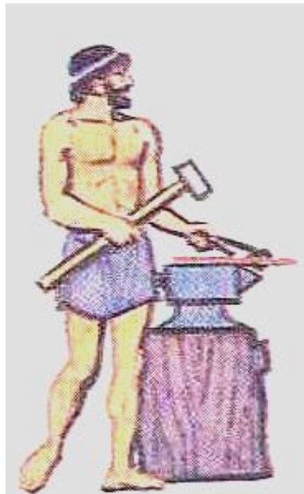
Гефест – бог огня и кузнечного дела