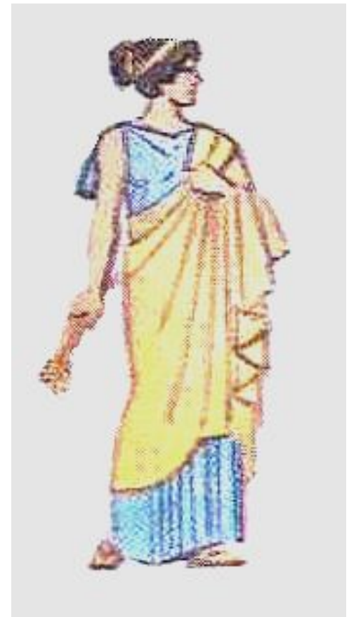
Деметра – богиня земледелия