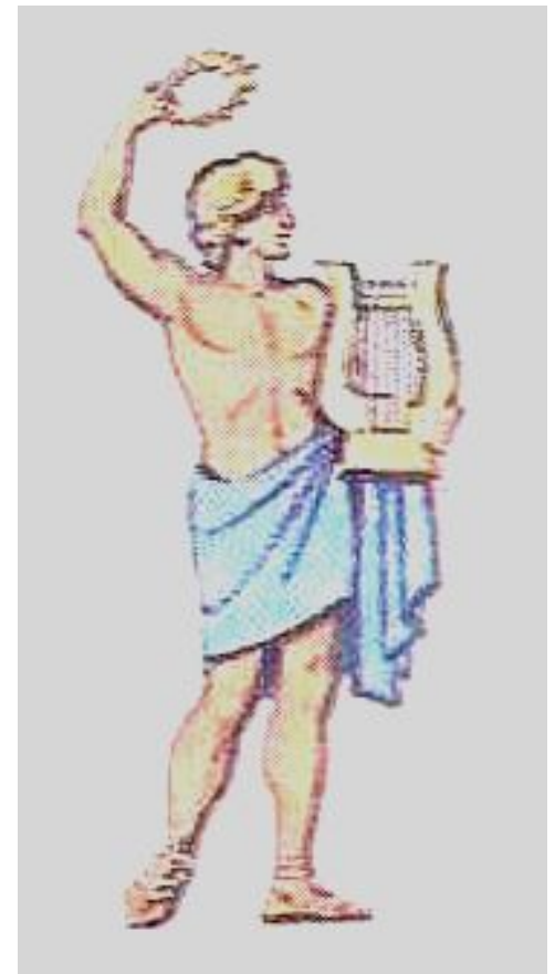
Аполлон – бог солнца