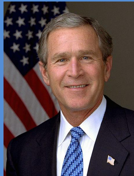
Джордж Уокер Буш 2000-2008 республиканец

государство- рынок- гражданское общество, снижение налогов, развитие бизнеса