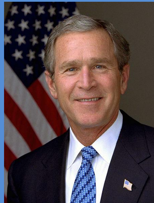
Джордж Уокер Буш 2000-2008 республиканец

государство- рынок- гражданское общество, снижение налогов, развитие бизнеса