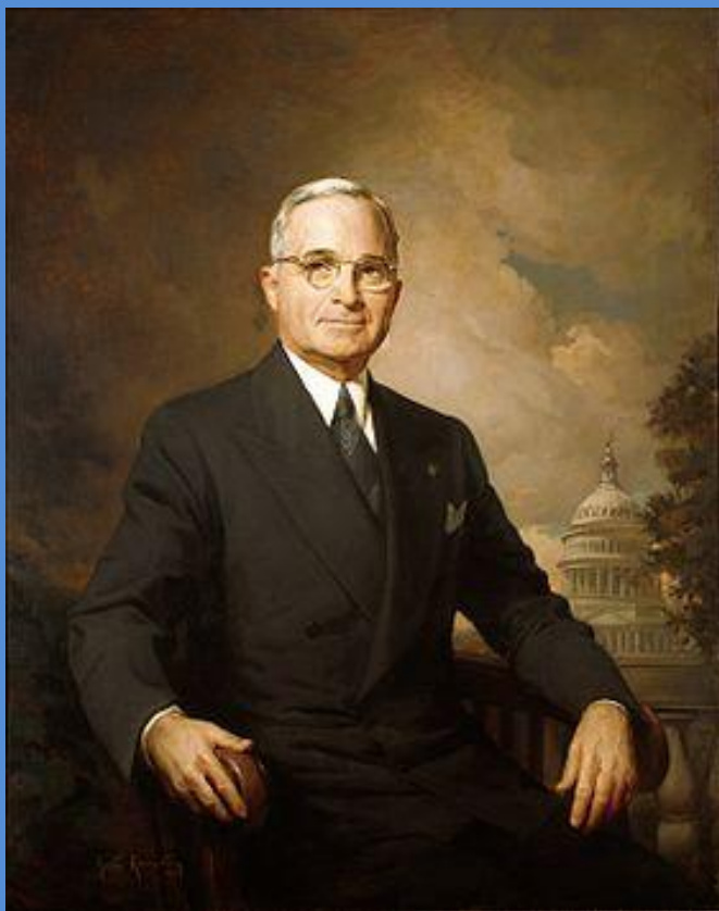
Гарри Эс Трумэн 1945-1952 демократ

1947 г. – закон Тафта –Хартли об ограничении профсоюзной деятельности. Маккартизм «Охота на ведьм».