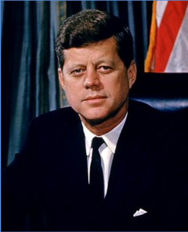
Джон Фицджеральд Кеннеди 1960-1963 демократ

Политика новых рубежей 1962 г. –карибский кризис Социальные программы: 1964 г. – о запрете дискриминации при найме на работу и при обслуживании в общественных местах; 1965 г. – закон о защите избирательных прав чернокожих американцев 1968 г. – закон о справедливом найме.