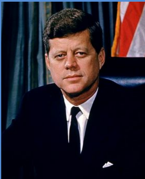
Джон Фицджеральд Кеннеди 1960-1963 демократ

Политика новых рубежей 1962 г. – карибский кризис Социальные программы: 1964 г. – о запрете дискриминации при найме на работу и при обслуживании в общественных местах; 1965 г. – закон о защите избирательных прав чернокожих американцев 1968 г. – закон о справедливом найме.