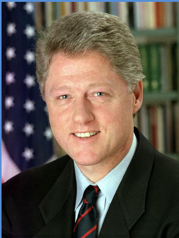
Уильям Джефферсон Клинтон 1992-2000 демократ

государство- рынок- гражданское общество, снижение налогов, развитие бизнеса