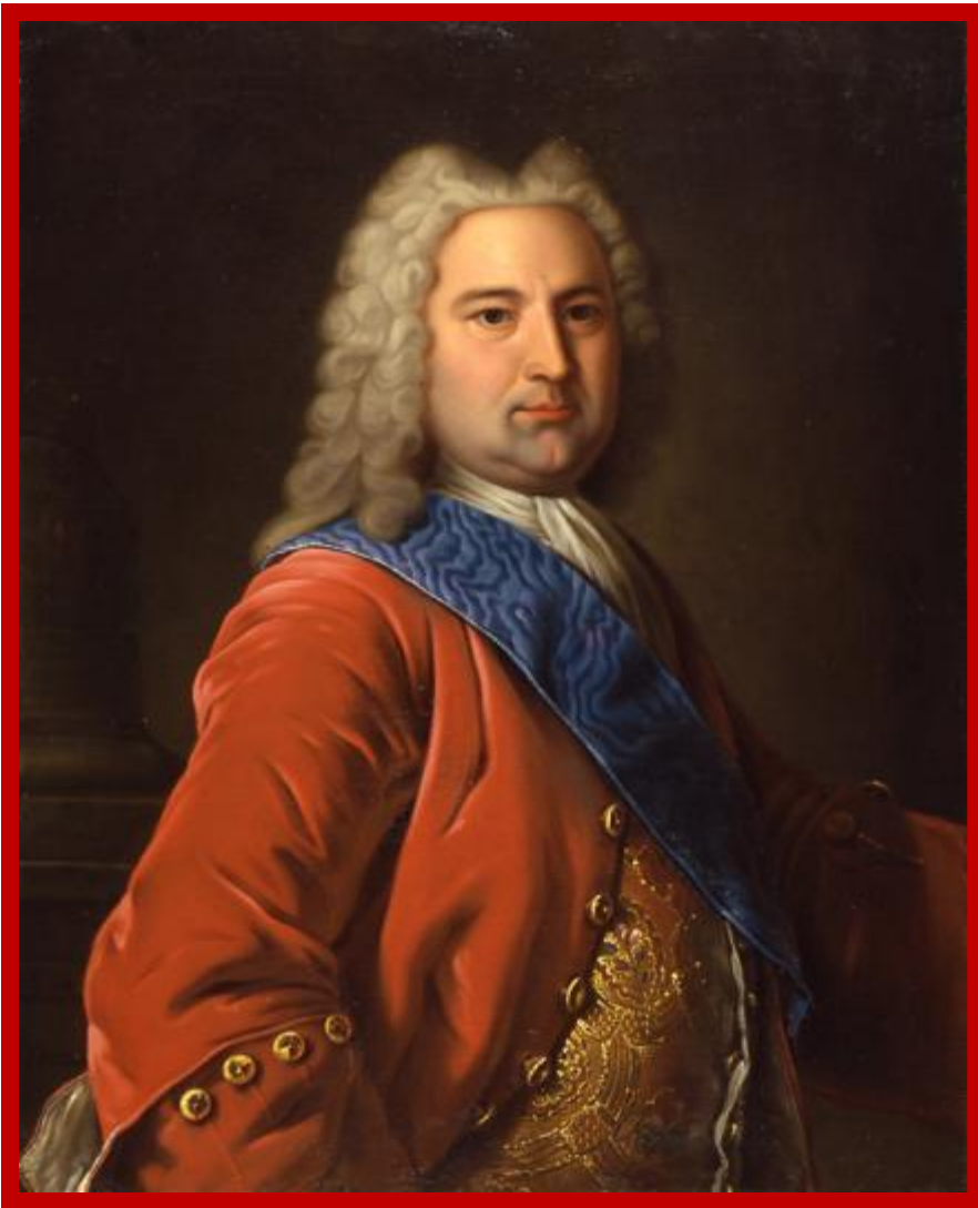
Эрнст Бирон – фаворит Анны Иоанновны