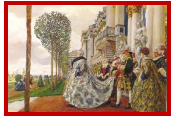
Императрица Елизавета Петровна в Царском Селе Е. Е. Лансере