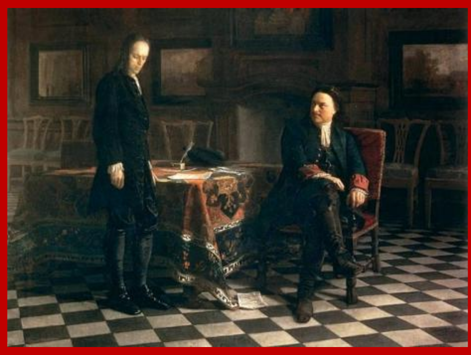
Николай Ге. Петр I допрашивает царевича Алексея Петровича в Петергофе