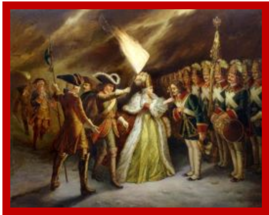
Филипп М.Р. Присяга преображенцев дочери Петра Великого.