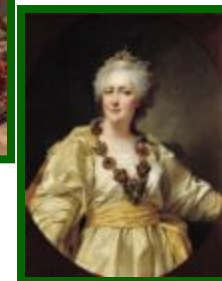
Екатерина II 1762-1796