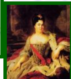
Екатери на I 1725-1727