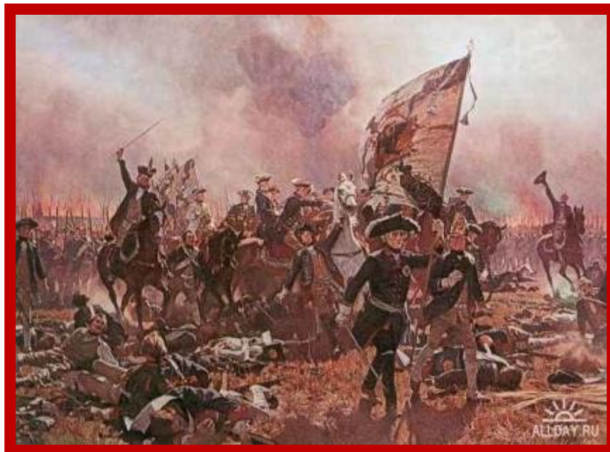
Сражение у Цорндорфа

1761 г. – смерть Елизаветы Петровны. Петр III заключил с Фридрихом II союз против своих бывших союзников и вернул Пруссии все завоевания.