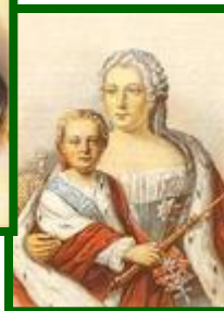
Иван VI Антонович и Анна Леопольдовна 1740-1741