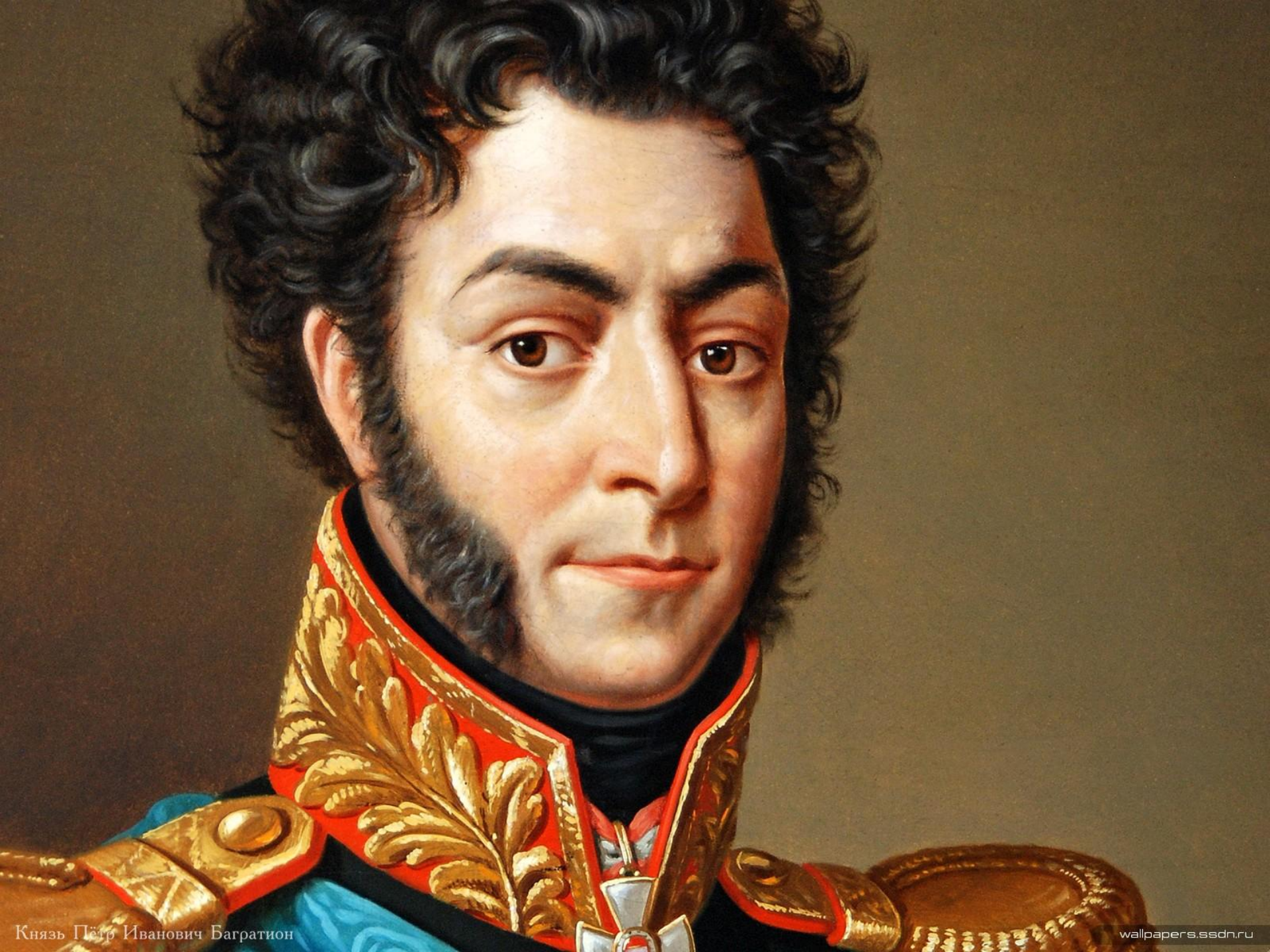
Князь Пётр Иванович Багратион