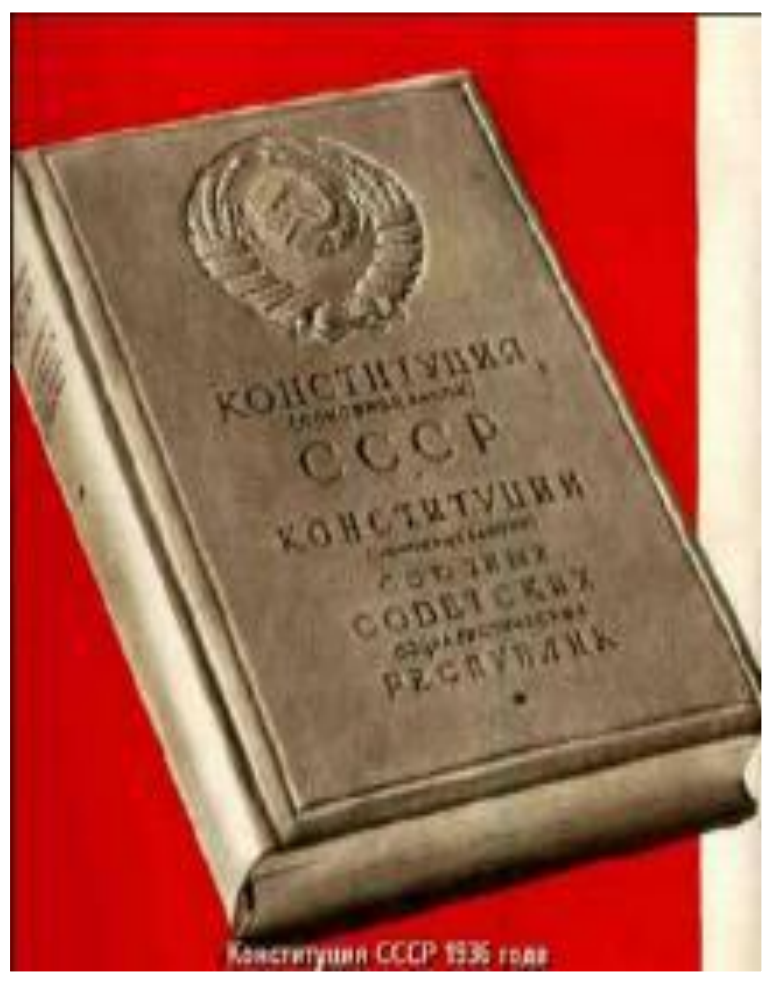
Конституция 1936 года.

Новая Конституция СССР принята 5 декабря 1936 г. была призвана укрепить власть политического руководства в лице лидеров Политбюро ЦК ВКП (б) И.В. Сталина, В.В. Молотова и К.Е. Ворошилова. Для стабилизации отношений с Европейскими странами Конституция провозглашала демократические права и свободы, разделение властей и маскировала авторитарный режим. Конституция провозгласила построение в СССР социализма и создание государственной и колхозно-кооперативной