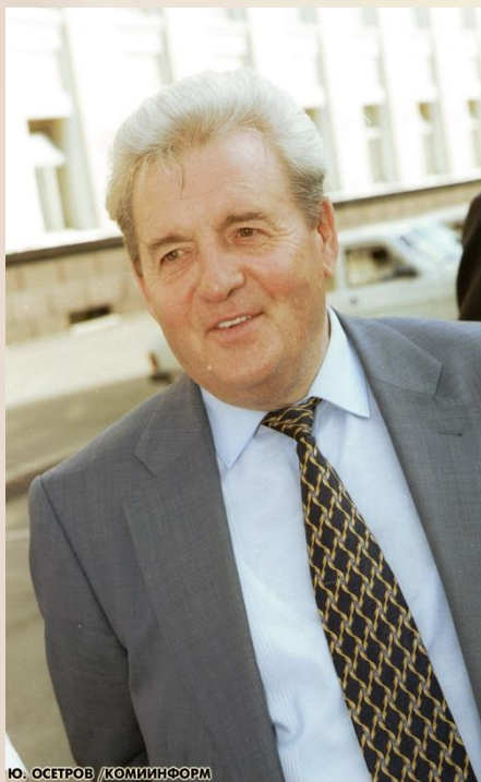
Ю. ОСЕТРОВ / КОМИИНФОРМ