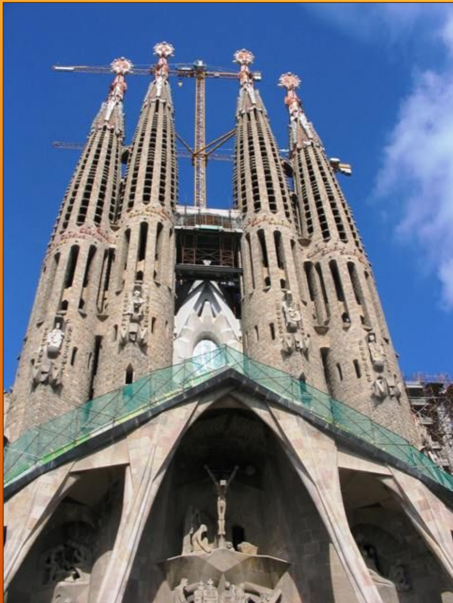
Храм Святого Семейства