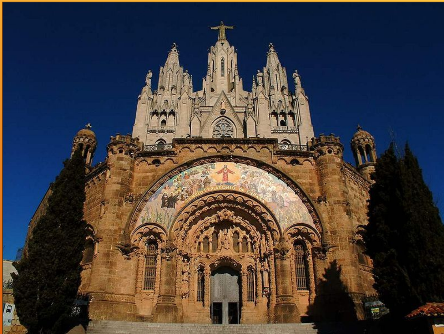
Храм Святого Сердца