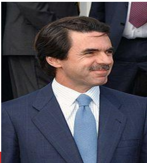
Хосе Мария Аснар