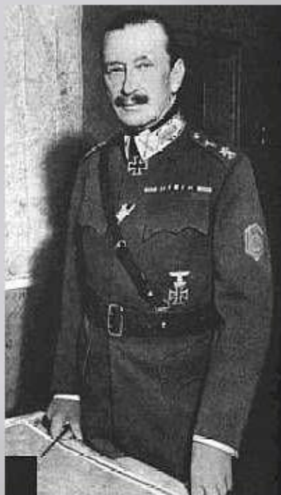
Карл Густав Эмиль Маннергейм

В феврале 1940 г. советские войска вышли к Выборгу – путь на Хельсинки был открыт