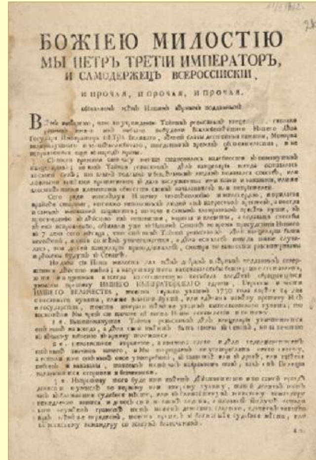
МАНИФЕСТ О ДАРОВАНИИ ВОЛЬНОСТИ РОССИЙСКОМУ ДВОРЯНСТВУ 18 февраля 1762 г.

Впервые в истории России дворяне освобождались от обязательной 25-летней гражданской и военной службы, могли выходить в отставку и беспрепятственно выезжать за границу. Однако по требованию правительства обязаны были служить в вооружённых силах во время войн, для чего возвращаться в Россию приходилось под угрозой конфискации земельвладений.