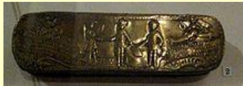
Табакерка на заключение мира между Пруссией, Россией и Швецией. 1762. Изображены три монарха в рукопожатии

Вторым чудом Бранденбургского дома называют внезапную смерть непримиримой противницы Фридриха, Елизаветы Петровны. Сменивший её на престоле племянник Пётр III, будучи поклонником Фридриха, первым делом разорвал союзный договор с Австрией и заключил сепаратный Петербургский мир с Пруссией, находившейся на грани поражения в Семилетней войне ввиду полного истощения людских и материальных ресурсов.