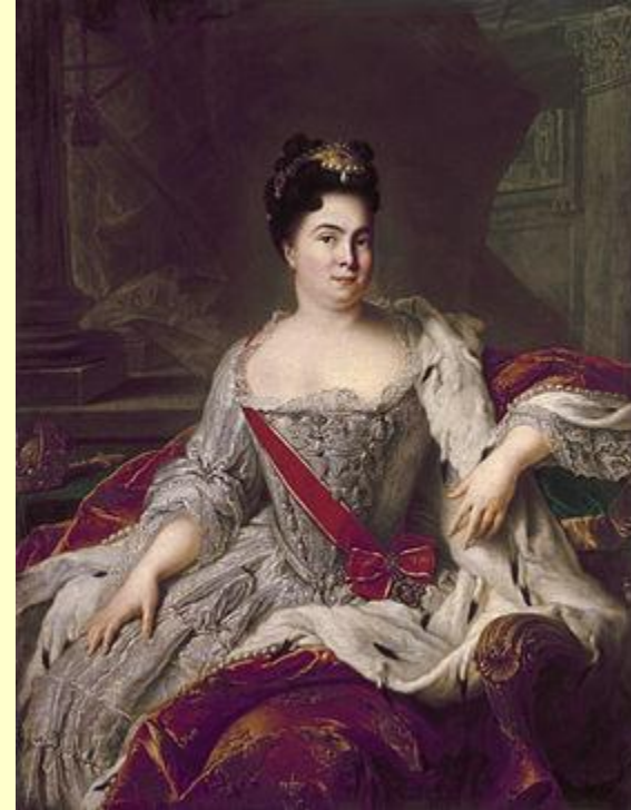
Екатерина I Алексеевна

В её честь Петром I учреждён орден (в 1713) и назван город на Урале (в 1723). Её имя носит также дворец в Царском Селе.