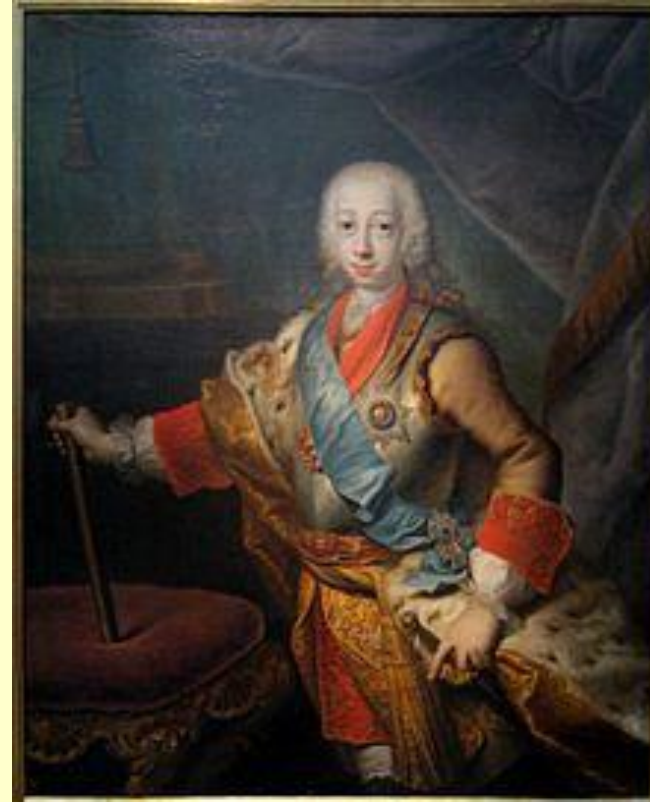
Пётр III Фёдорович

Во времена правления Екатерины именем этого императора называли себя многие самозванцы (зафиксировано около 40 случаев), самым известным из которых был Емельян Пугачёв.