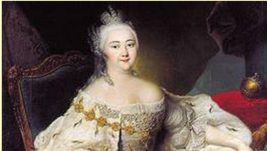
Елизавета I Петровна

В. О. Ключевский называет эту правительницу следующим образом: «Наиболее законная из всех преемников и преемниц Петра I».