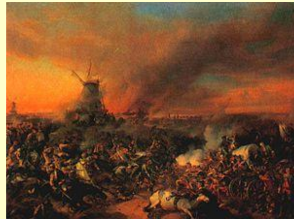
Сражение при Цорндорфе