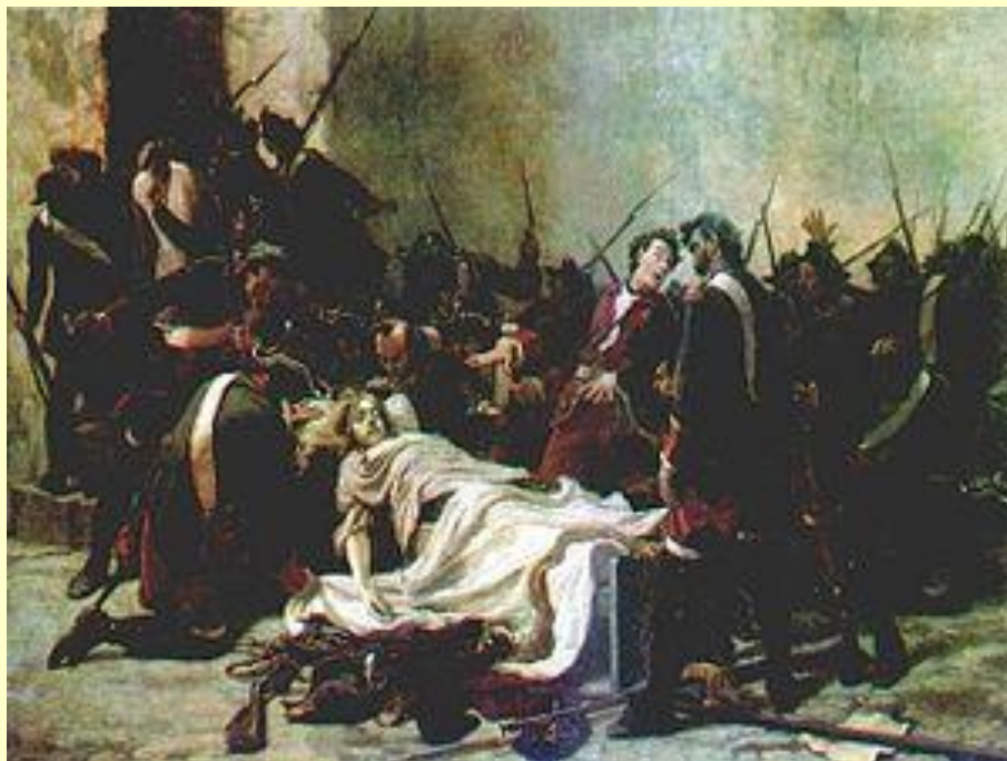
Мирович перед телом Ивана VI. Картина Ивана Творожникова (1884)

С 1756 года находился в Шлиссельбургской крепости. Был убит стражей при попытке офицера В.Я. Мировича освободить его и провозгласить императором вместо Екатерины II .