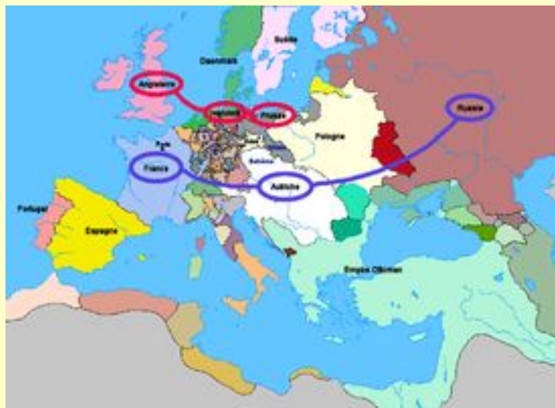
Противоборствующие коалиции в Европе 1756 года

Основное противостояние в Европе происходило между Австрией и Пруссией из-за Силезии, потерянной Австрией в предыдущих Силезских войнах. Поэтому эту войну называют также третьей Силезской войной. В шведской историографии война известна как Померанская война, в Канаде — как «Завоевательная война» и в Индии как «Третья Карнатская война». Североамериканский театр войны называют франко-индейской войной.