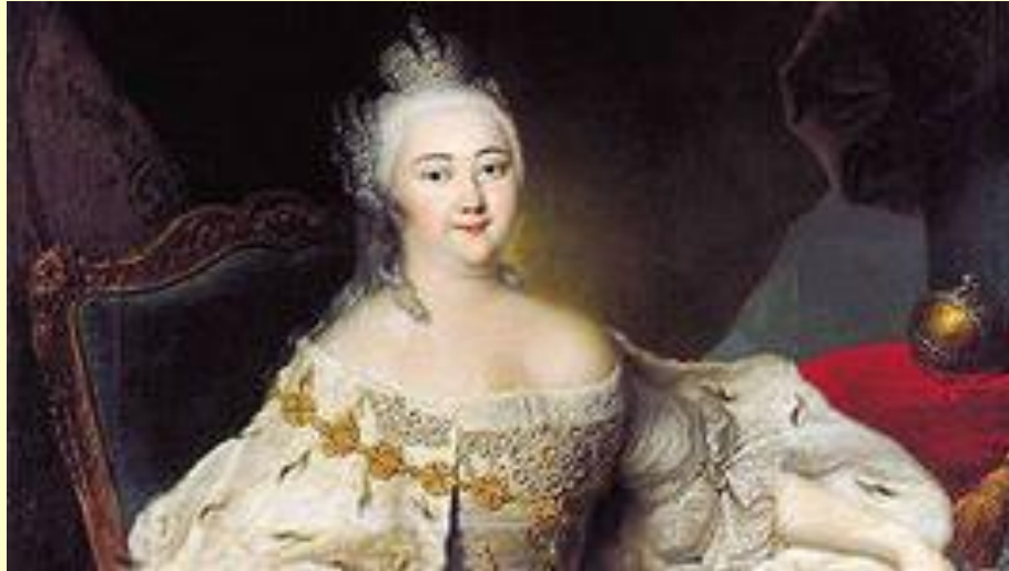
Елизавета I Петровна

В. О. Ключевский называет эту правительницу следующим образом: «Наиболее законная из всех преемников и преемниц Петра I».