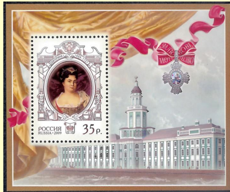
Екатерина I Алексеевна

В годы правления этого императора (императрицы) была открыта Академия наук, организована экспедиция В. Беринга, учреждён орден Святого Александра Невского.