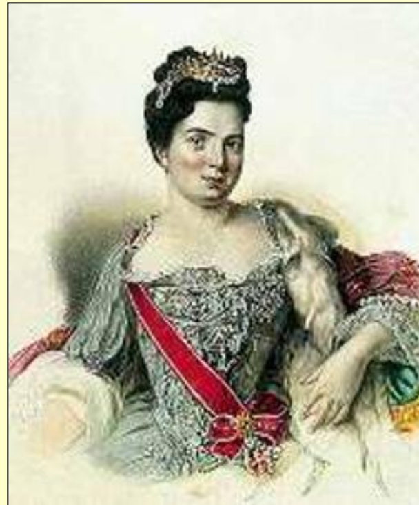
Екатерина I Алексеевна

Императрица всероссийская. Родилась 5 апреля 1684 г. в Лифляндии, в крестьянской семье, литовского или латышского происхождения, и при крещении по католическому обряду была названа Мартой.