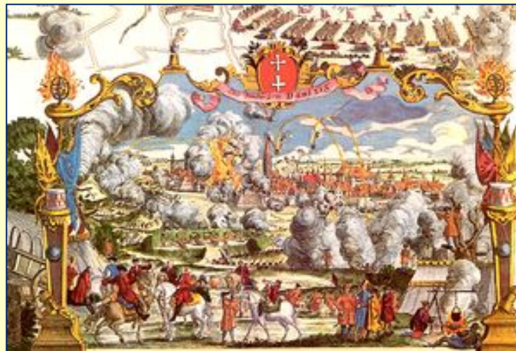
Война за польское наследство

В 1733 году умер король Август II и в стране началось бескорольевье. Франции удалось поставить своего ставленника — Станислава Лещинского. Для России это могло стать серьёзной проблемой, так как Франция создала бы блок государств вдоль границ России в составе Речи Посполитой, Швеции и Османской империи. Поэтому, когда сын Августа II Август III обратился к России, Австрии и Пруссии с «Декларацией благожелательных», в которой просил защитить польскую «форму правления» от вмешательства Франции, это дало повод для войны (1733—1735).