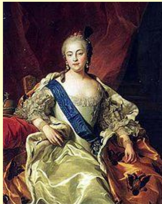
Елизавета I Петровна

Императрица родилась в Коломенском дворце 18 декабря 1709 года. День этот был торжественным: её отец въезжал в Москву, желая отметить в столице свою победу над Карлом XII, но при вступлении в столицу его известили о рождении младшей дочери. «Отложим празднество о победе и поспешим поздравить с пришествием в этот мир мою дочь!», — сказал он.