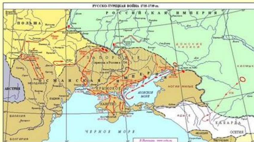
Карта боевых действий русско-турецкой войны 1735-1739 гг.

Во время этой войны русская армия дважды входила в Крым и разоряла его, были захвачены крепости Очаков и Хотин. Однако неумелые действия командовавшего армией Миниха, приведшие к большим людским потерям, вынудили Россию подписать невыгодный для нее Белградский мир, по которому она должна была вернуть все завоеванные земли.