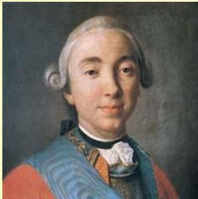
Петр III Федорович

К числу важнейших дел этого императора (императрицы) можно отнести: упразднение Тайной канцелярии, секуляризацию церковных земель, создания Госбанка, указ, по которому за убийство крепостных предусматривалась пожизненная ссылка. Издан Манифест о вольности дворянства. Прекратились военные действия против Пруссии.