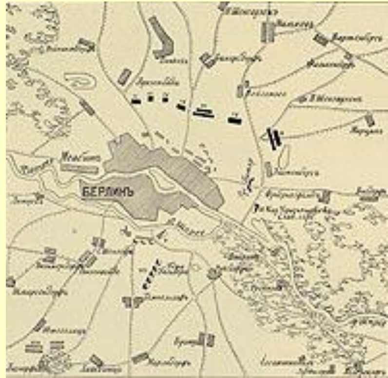
Взятие Берлина (1760)

22 сентября к ..... подошел конный русский отряд под командованием генерала Тотлебена. После недолгой артиллерийской подготовки Тотлебен в ночь на 23 сентября штурмовал столицу Пруссии . Взятие этого города имело для русских скорее финансовое, чем военное значение. Не менее важна была и символическая сторона данной операции. Это было первое в истории взятие этого города русскими войсками. Интересно, что в 20 веке перед решающим штурмом этого же города советские бойцы получили символический подарок - копии ключей от этого города, врученных немцами русским воинам в 1760 г.