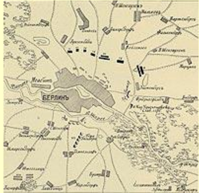
Взятие Берлина (1760)

22 сентября к ..... подошел конный русский отряд под командованием генерала Тотлебена. После недолгой артиллерийской подготовки Тотлебен в ночь на 23 сентября штурмовал столицу Пруссии . Взятие этого города имело для русских скорее финансовое, чем военное значение. Не менее важна была и символическая сторона данной операции. Это было первое в истории взятие этого города русскими войсками. Интересно, что в 20 веке перед решающим штурмом этого же города советские бойцы получили символический подарок - копии ключей от этого города, врученных немцами русским воинам в 1760 г.