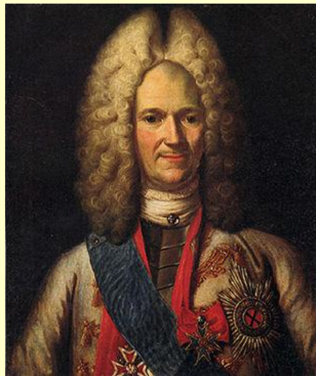
Александр Данилович Меншиков

В его руках была сконцентрирована огромная власть. Он был президентом Военной коллегии, генерал-фельдмаршалом, вице-адмиралом, подполковником Преображенского полка, генерал-губернатором Петербурга. А.С. Пушкин писал: «Полудержавный властелин стал властелином полным».