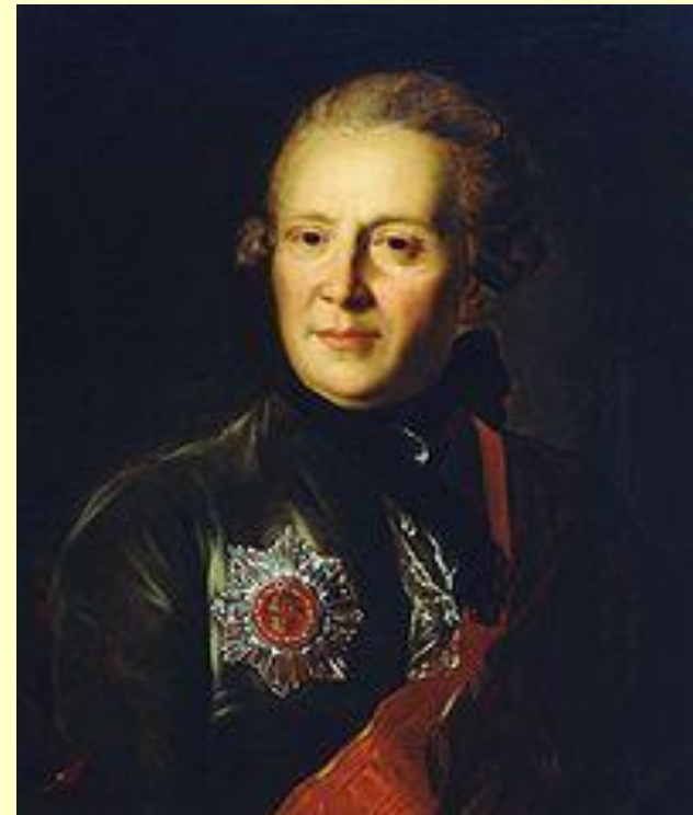
Александр Петрович Сумароков

Из указа Елизаветы Сенату от 30 августа 1756 г.: