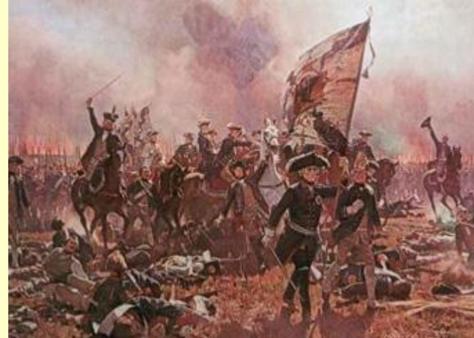
Фридрих II в битве при Цорндорфе

Эта битва относится к числу самых кровопролитных сражений XVIII-XIX вв. На другой день Фермер отступил первым. Это дало Фридриху повод приписать победу себе. Однако, понеся большие потери, он не решился преследовать русских и отвел свое потрепанное войско к Кюстрину. Этим сражением Фермер фактически завершил кампанию 1758 г. Осенью он отошел на зимние квартиры в Польшу. После этой битвы Фридрих произнес фразу, вошедшую в историю: "Русских легче перебить, чем победить".