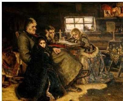
Суриков В.И. Меншиков в Березове. 1883 г.