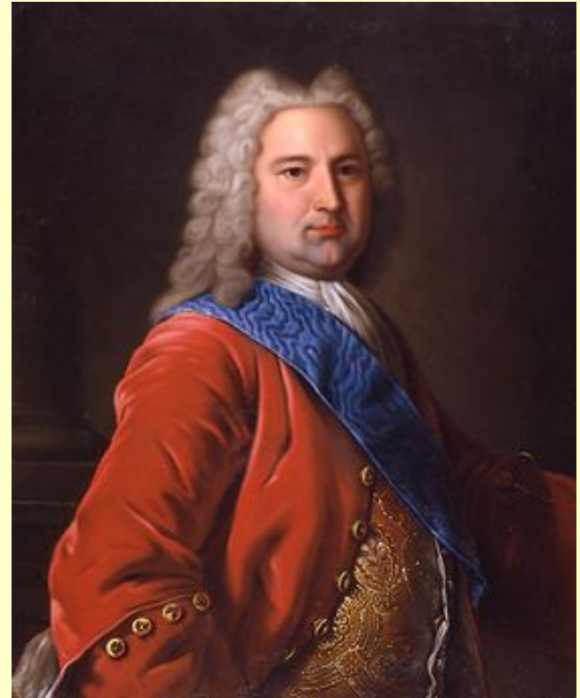
Эрнст Иоганн Бирон

Данный период определяется как крайне реакционный режим в России в 30х гг. 18 в. в царствование императрицы Анны Иоанновны, названный так по имени её фаворита вдохновителя и создателя этого режима. Характерными его чертами называют "засилье иноземцев", главным образом немцев, во всех областях государственной и общественной жизни, хищническую эксплуатацию народа, разграбление богатств страны, жестокие преследования недовольных, шпионаж, доносы.