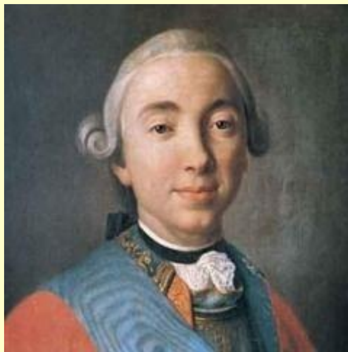
Петр III Федорович

К числу важнейших дел этого императора (императрицы) можно отнести: упразднение Тайной канцелярии, секуляризацию церковных земель, создания Госбанка, указ, по которому за убийство крепостных предусматривалась пожизненная ссылка. Издан Манифест о вольности дворянства. Прекратились военные действия против Пруссии.