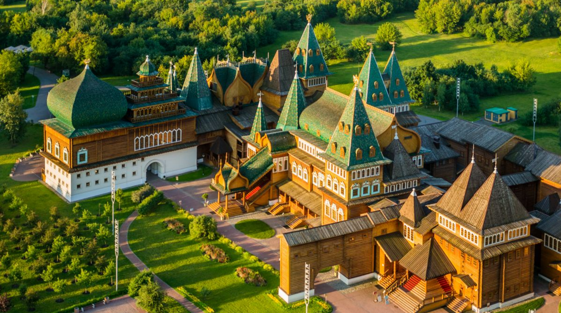
Дворец Алексея Михайловича в Коломенском