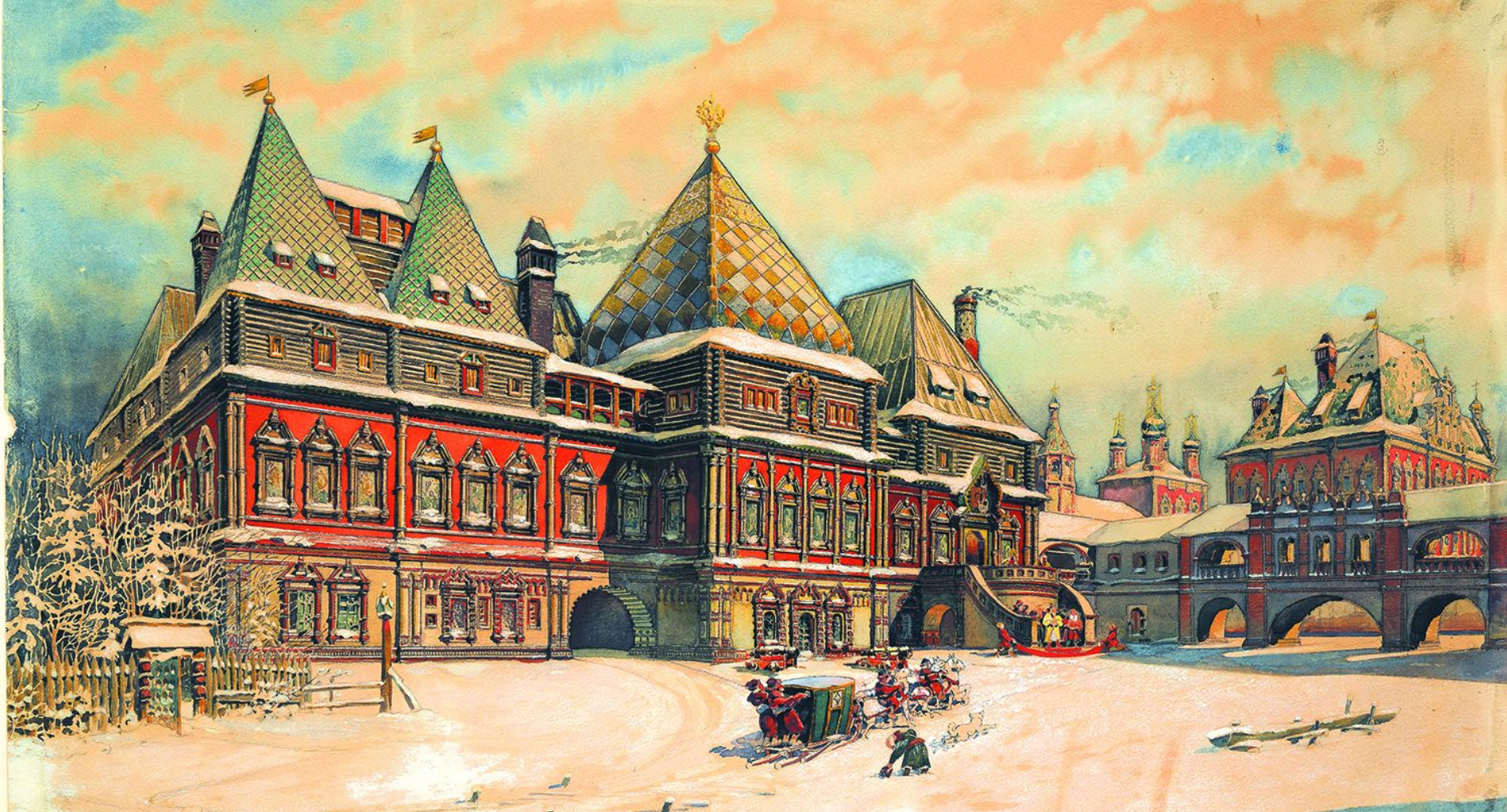
ПАЛАТЫ ГОЛИЦЫНА В ОХОТНОМ РЯДУ В XVII ВЕКЕ. РЕКОНСТРУКЦИЯ Д.П. СУХОВА. 1936 ГОД