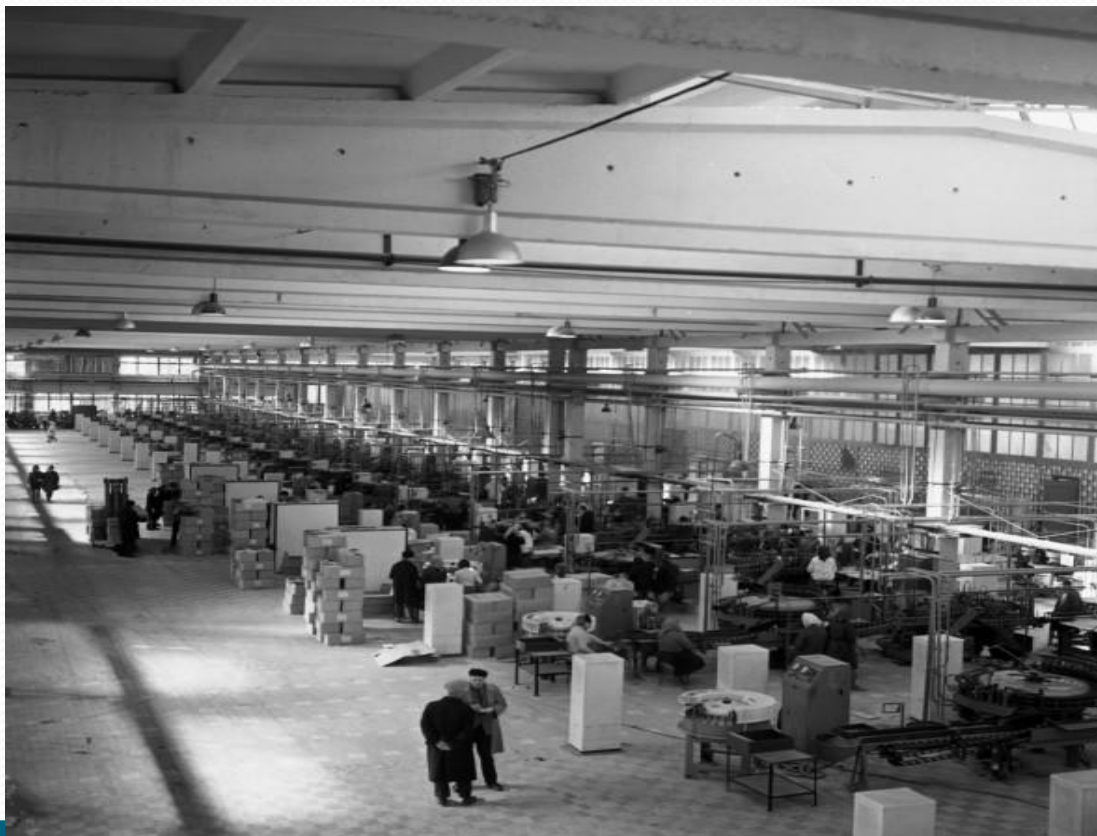
Майлы-Сай шаарындагы электр-лампа заводу