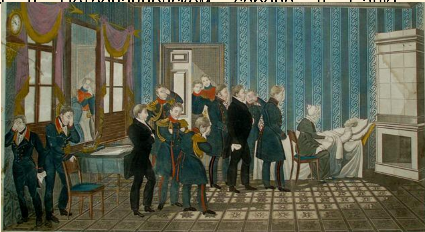
СМЕРТЬ ГОСУДАРЯ ИМПЕРАТОРА АЛЕКСАНДРА БЛАГОСЛОВЕННОГО ВЪ ТАГАНРОГѢ 19 НОЯБРЯ 1825 ГОДА

[Small text at the bottom of the page, likely a transcription or commentary on the illustration.]