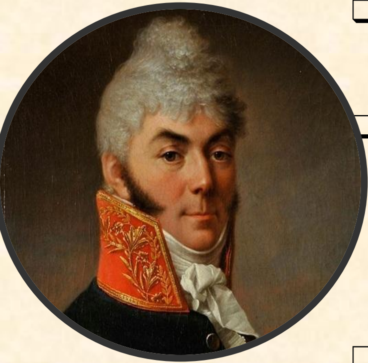
Н. Н. Новосильцев