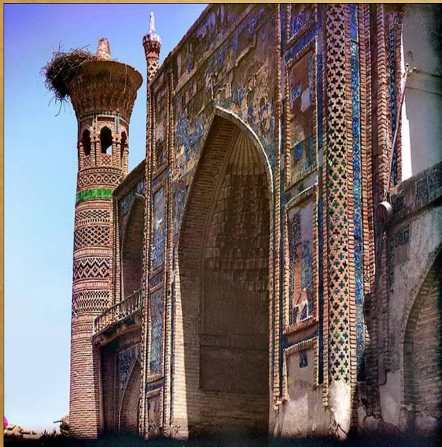
Медресе в Бухаре