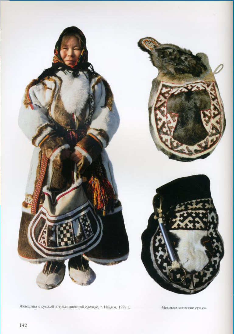
Женщина с сумкой в традиционной одежде, г. Надам, 1997 г.