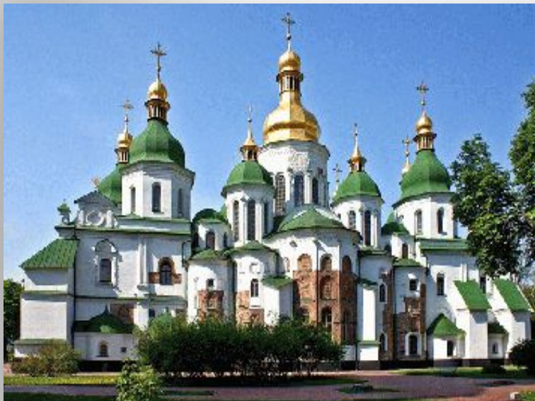
Десятинная церковь в Киеве

Алтарь- особое место в храме, где находятся главные иконы