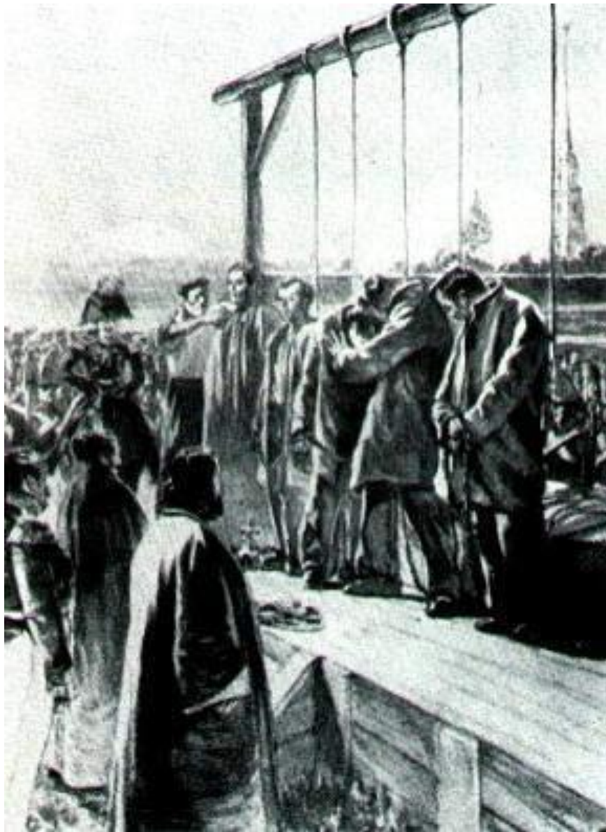
Д.Кардовский Казнь декабристов

10 (22) июля 1826 Николай I смягчил приговор для декабристов, сохранив смертную казнь через повешение только для главных «зачинщиков»: