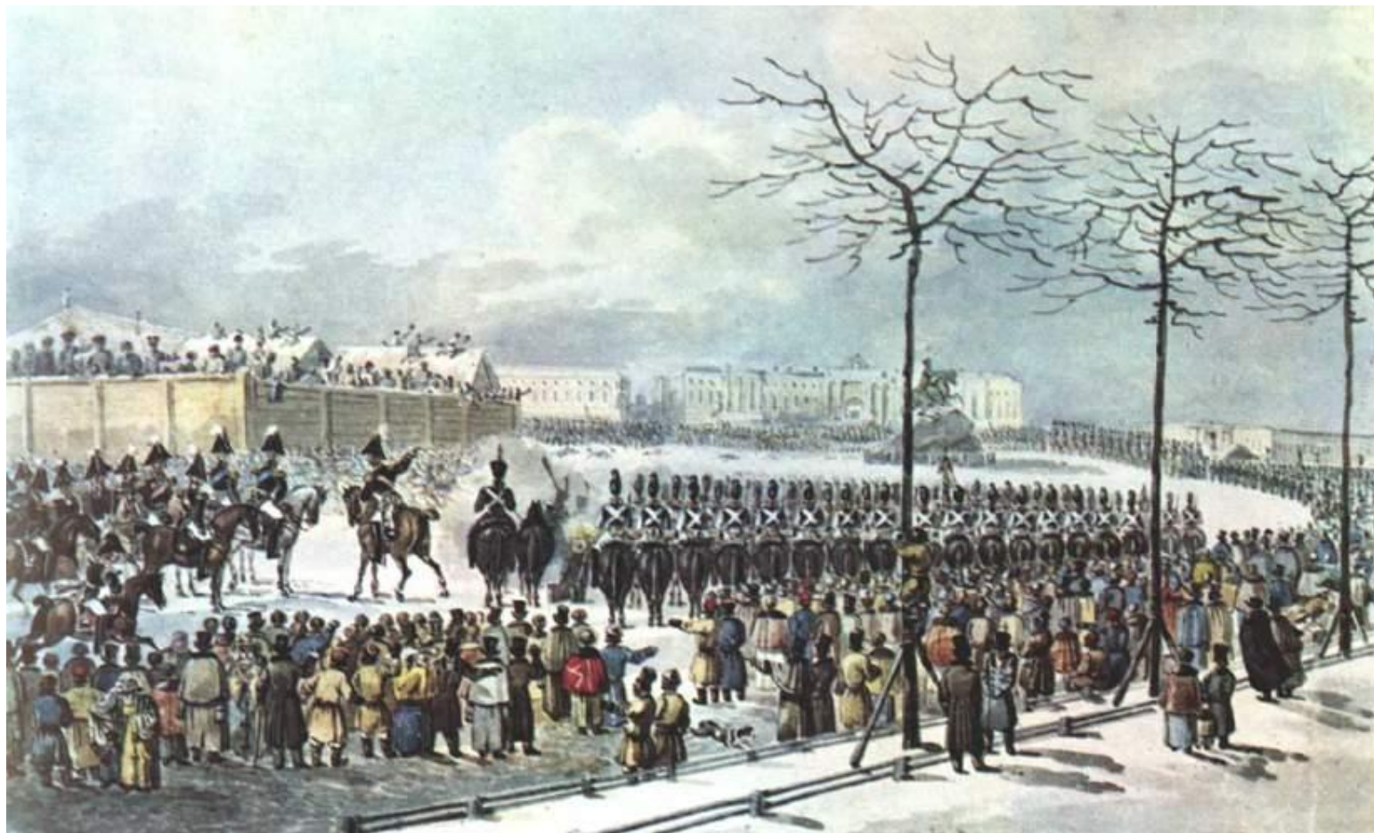
Восстание на Сенатской площади 14 декабря 1825 г. С картины К.И. Кольмана

Рано утром 14 декабря 1825 г. декабристы вывели на Сенатскую площадь Московский полк (Н.Бестужев и Дм. Ростовский-Шепин) и Гвардейский Морской экипаж (С.Булатов). Солдаты и моряки не знали истинной причины восстания. Площадь была оцеплена правительственными войсками.