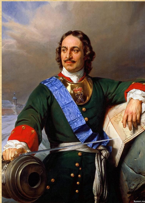
Пётр I Великий