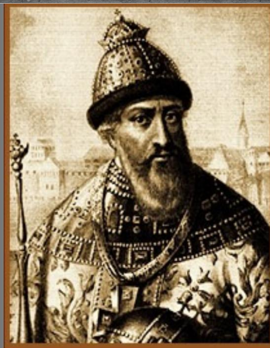
Василий Шуйский (1606-1610)