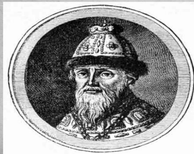
Князь Федор Иванович Мстиславский

1610 – 1612 годы междуцарствия, правило правительство из 7 бояр - семибоярщина