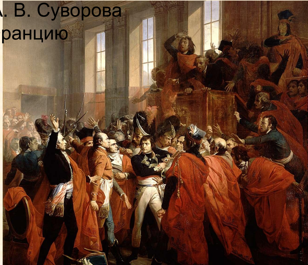
Наполеон в Совете 500