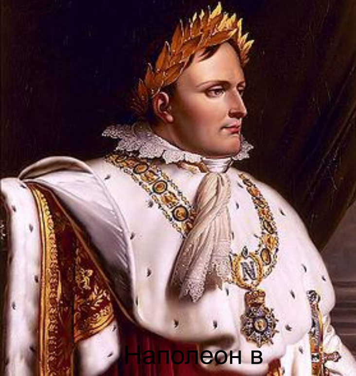
Наполеон в императорском облачении

□ 1804г. – провозглашение Наполеона императором