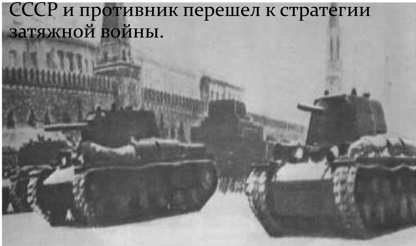
С Красной площади танки направляются на фронт