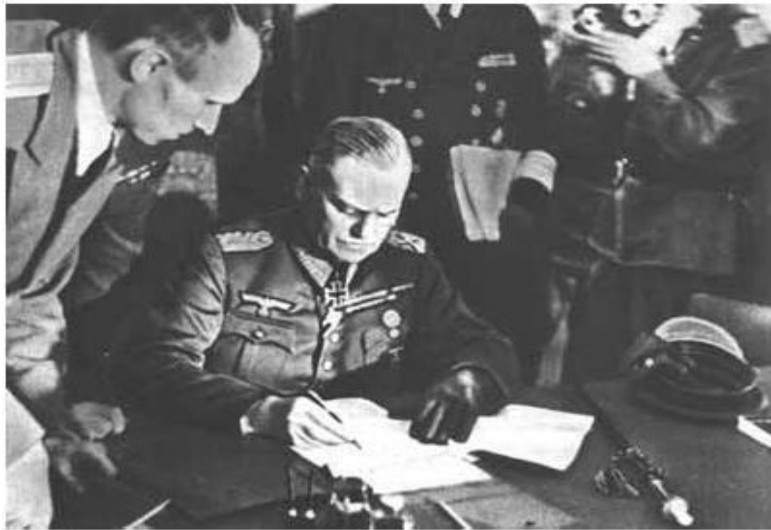
Начальник генерального штаба Верховного главнокомандования вермахта В. Кейтель подписывает Акт о безоговорочной капитуляции Германии