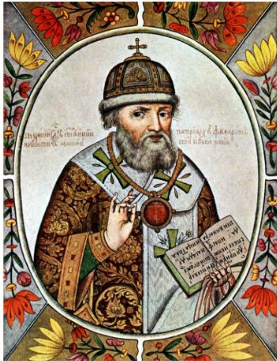
Патриарх Филарет. Миниатюра XVII в.