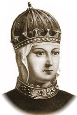
Милославская Мария (1626–1669)

Русская царица, первая жена царя Алексея Михайловича