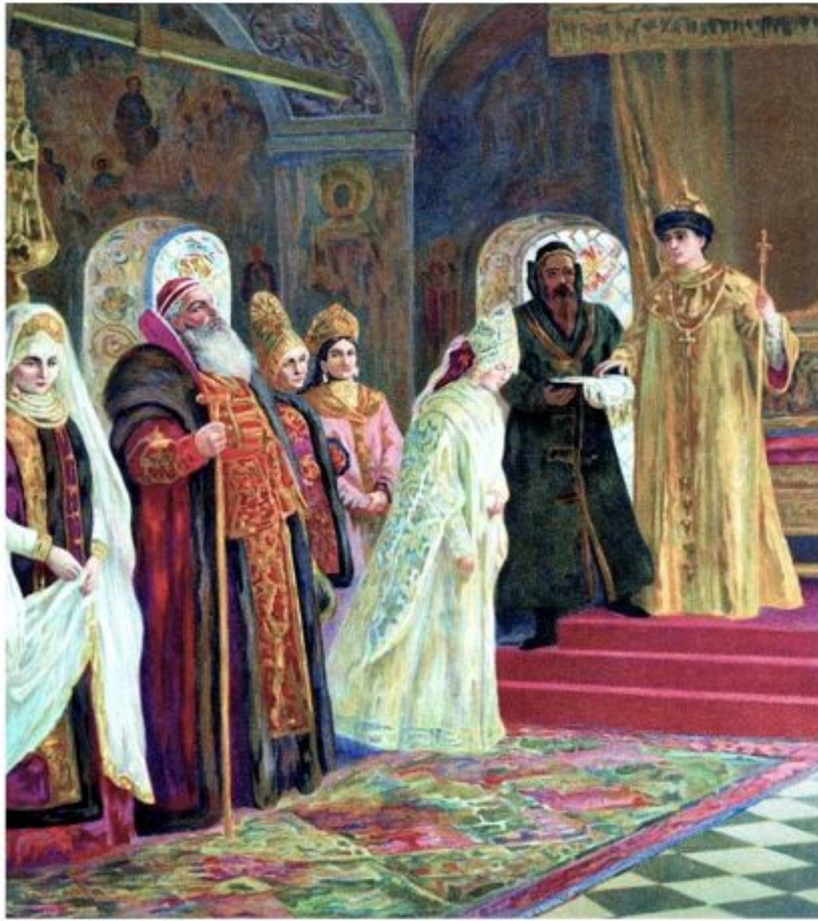
Выбор невесты царём Алексеем Михайловичем. Художник К. Е. Маковский