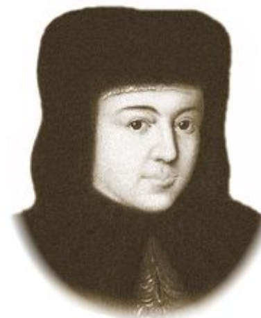
Нарышкина Наталья (1651–1694)

Русская царица, вторая жена царя Алексея Михайловича