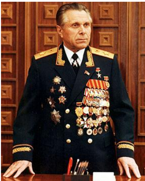
Николай Анисимович Щёлоков Министр внутренних дел СССР 1966-1982