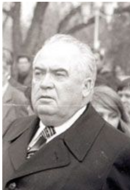
Сергей Фёдорович Медунов Первый секретарь Краснодарского крайкома КПСС