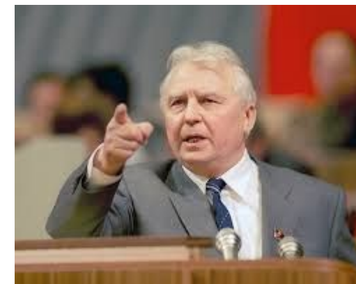
Егор Кузьмич Лигачёв