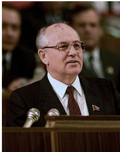
Михаил Сергеевич Горбачёв