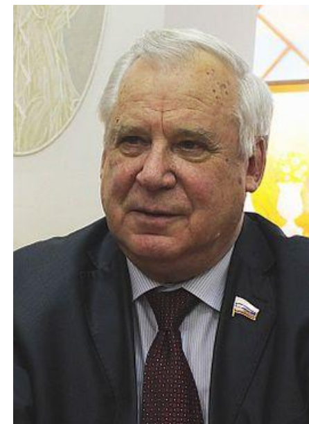
Николай Иванович Рыжков