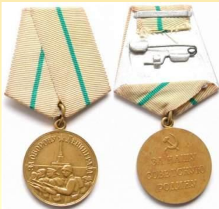
Медаль «За оборону Ленинграда»