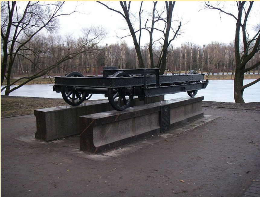
Памятный знак «Вагонетка»