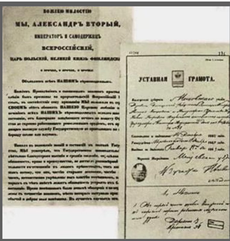
Документы крестьянской реформы

В декабре 1860 г. Проект был рассмотрен в Госсовете и 19 февраля 1861 г. Александр II подписал «Манифест» и «Положения» (всего - 17 документов).