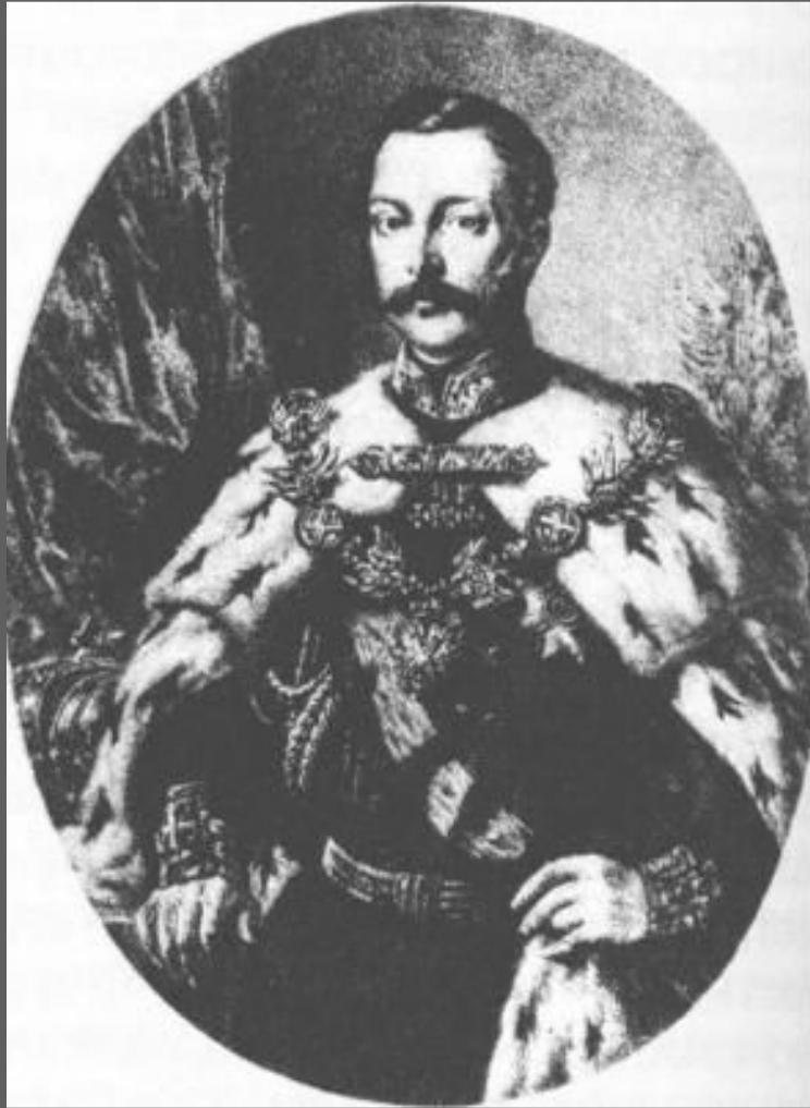
Император Александр II

30.03.1856 г. на встрече с московским дворянством Александр II заявил, что крепостное право лучше отменить сверху, чем ждать, пока оно само собою отменится снизу.