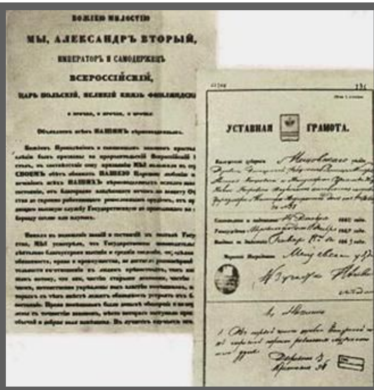
Документы крестьянской реформы

В декабре 1860 г. Проект был рассмотрен в Госсовете и 19 февраля 1861 г. Александр II подписал «Манифест» и «Положения» (всего - 17 документов).