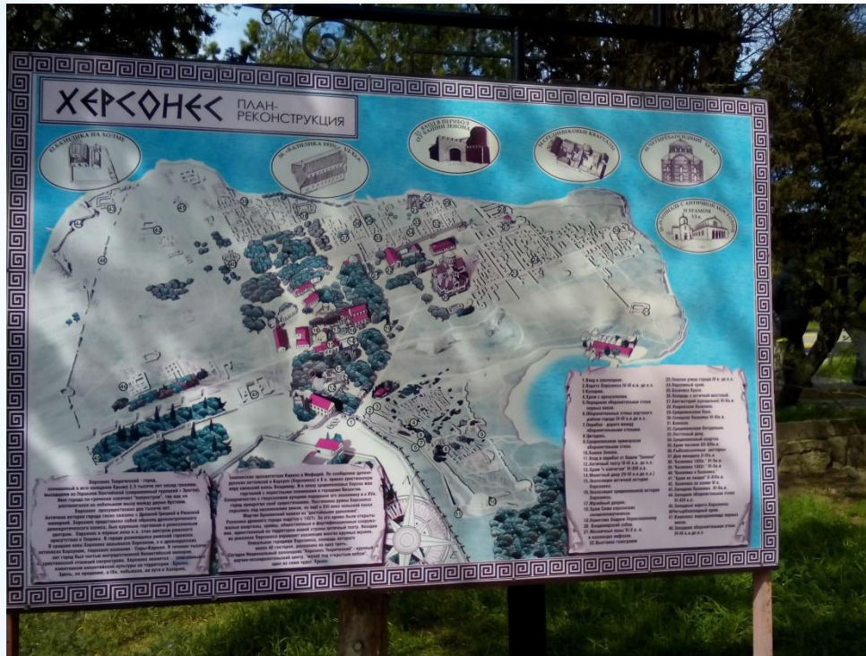
* Карта херсонеса