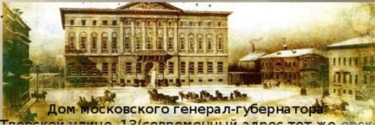
Дом московского генерал-губернатора на Тверской улице, 13 (современный адрес тот же, а в 1812 году - на Тверской улице, 13)

20 августа 1812 года Н. М. Карамзин писал И. И. Дмитриеву: «Я <...> готов умереть за Москву. <...> Я рад сесть на своего серого коня и вместе с Московскою удалою дружиною примкнуть к нашей Армии». Отправив семью в Ярославль, Николай Михайлович пошел записываться в ополчение в дом московского генерал-губернатора. Главнокомандующий Москвы Ф. В. Ростопчин «отказал в зачислении, <...>