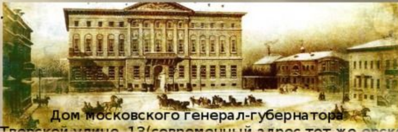
Дом московского генерал-губернатора на Тверской улице, 13 (современный адрес тот же, а в 1812 году - на Мясницкой)

20 августа 1812 года Н. М. Карамзин писал И. И. Дмитриеву: «Я <...> готов умереть за Москву. <...> Я рад сесть на своего серого коня и вместе с Московскою удалою дружиною примкнуть к нашей Армии». Отправив семью в Ярославль, Николай Михайлович пошел записываться в ополчение в дом московского генерал-губернатора. Главнокомандующий Москвы Ф. В. Ростопчин «отказал в зачислении, <...>