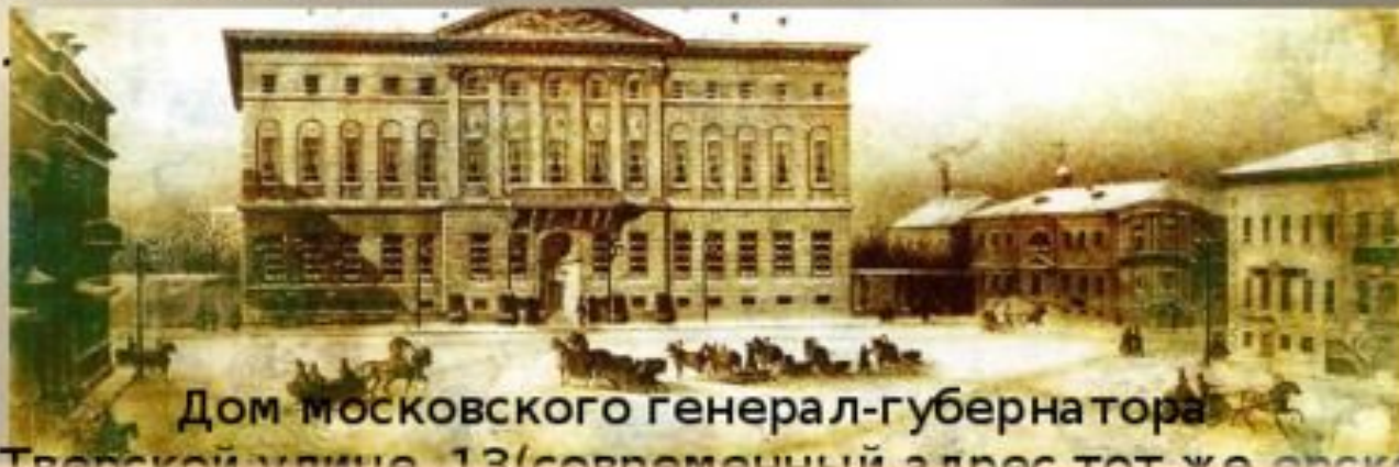
Дом московского генерал-губернатора на Тверской улице, 13 (современный адрес тот же, с 1993 года)

20 августа 1812 года Н. М. Карамзин писал И. И. Дмитриеву: «Я <...> готов умереть за Москву. <...> Я рад сесть на своего серого коня и вместе с Московскою удалою дружиною примкнуть к нашей Армии». Отправив семью в Ярославль, Николай Михайлович пошел записываться в ополчение в дом московского генерал-губернатора. Главнокомандующий Москвы Ф. В. Ростопчин «отказал в зачислении, <...>