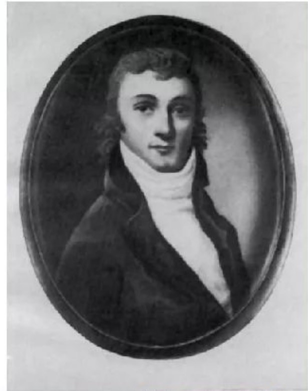
Н.М. Карамзин в молодости