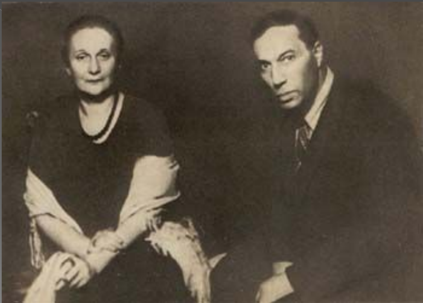
⦿ Анна Ахматова и Борис Пастернак. Москва. 1946 г.