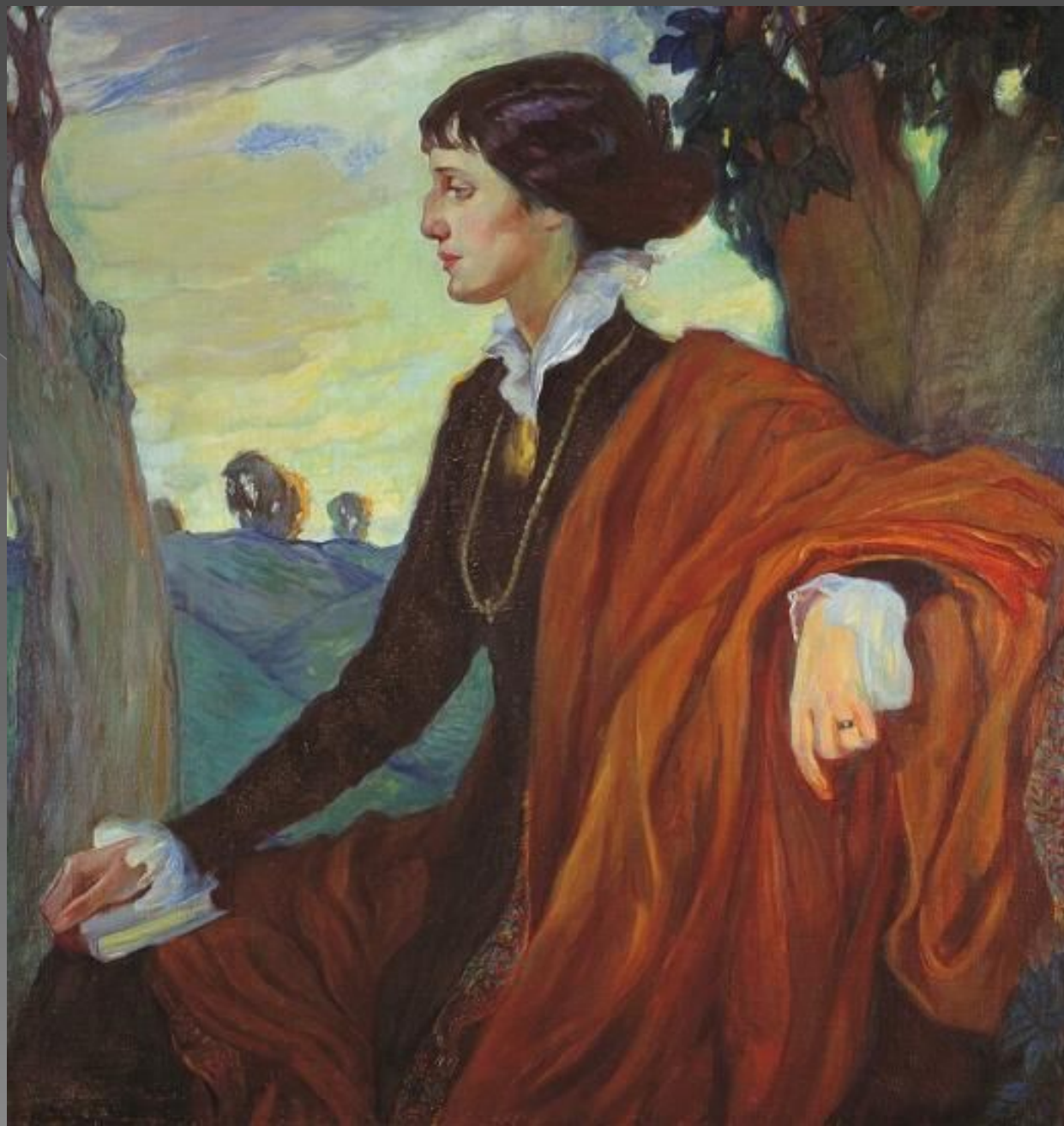
Портрет Ахматовой работы Ольги Кардовской, 1914 год