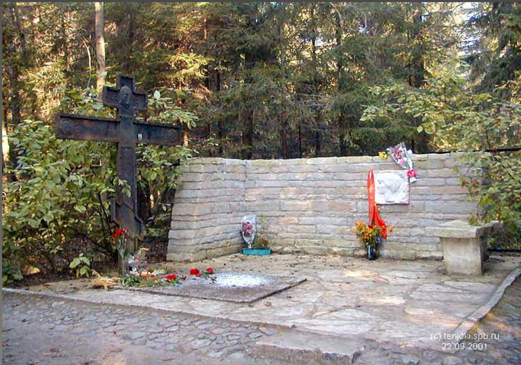
● Могила Анны Ахматовой