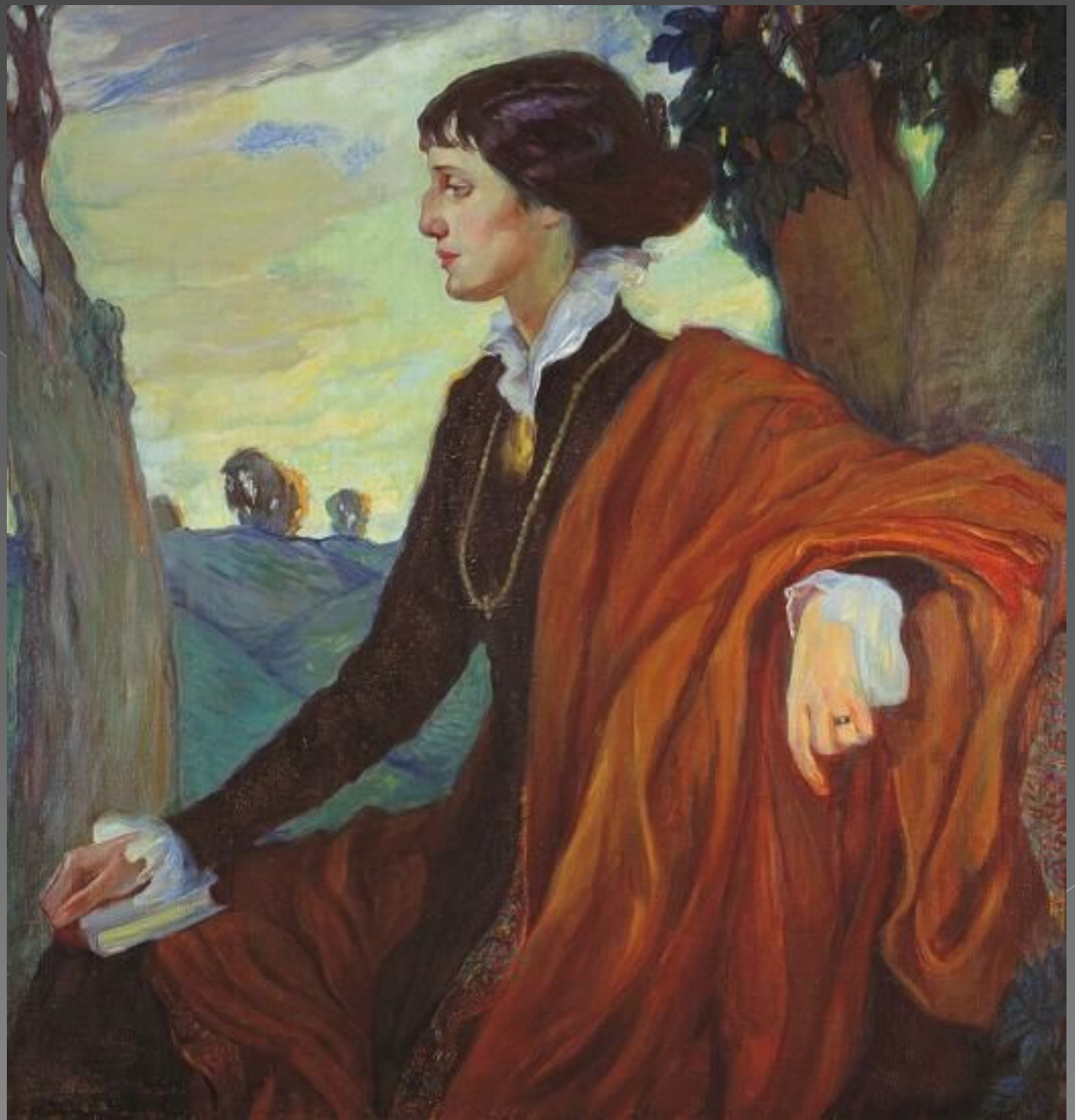
Портрет Ахматовой работы Ольги Кардовской, 1914 год