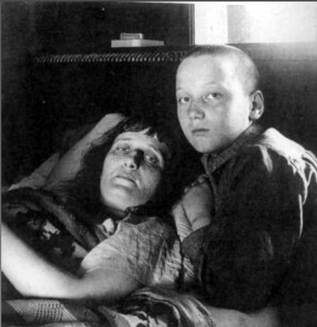
Анна Ахматова с сыном Львом. сер. 1920-х.