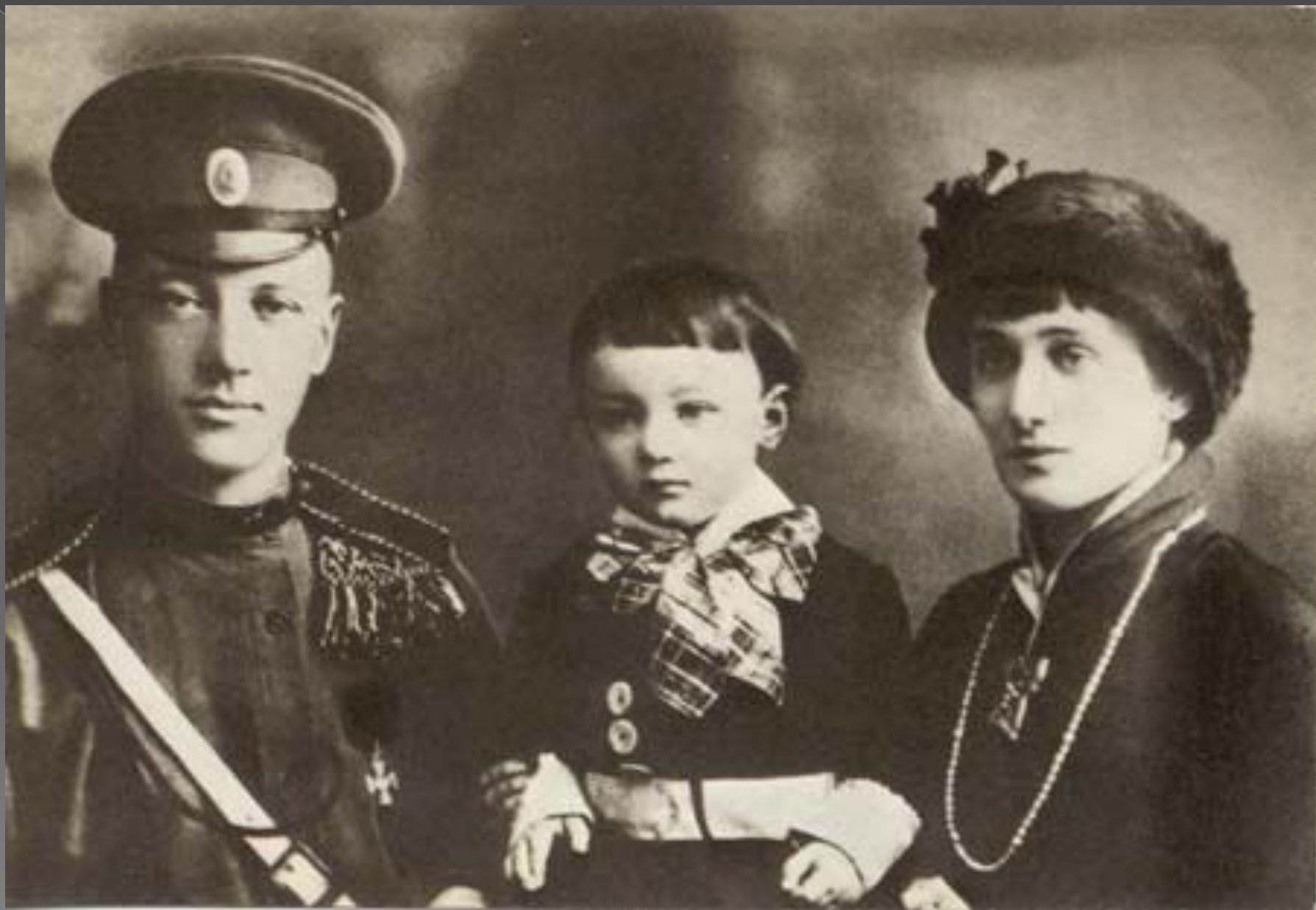
● Н.С.Гумилев, Лев Гумилев, А.А.Ахматова. Царское Село. 1916