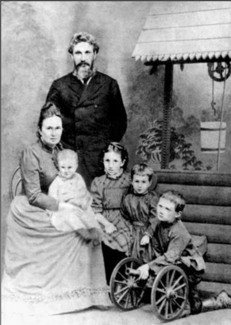
● Семья Горенко