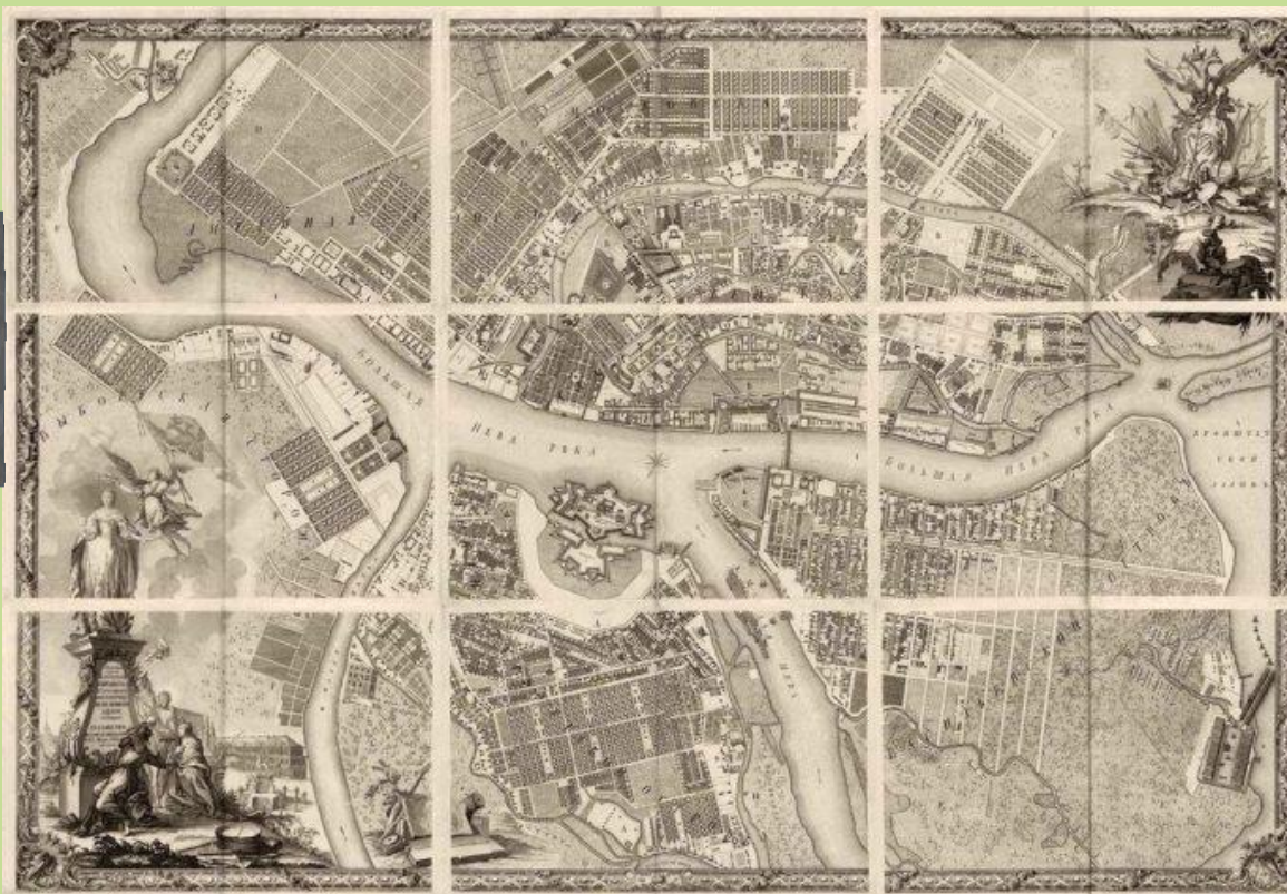
Генеральный план Санкт-Петербурга