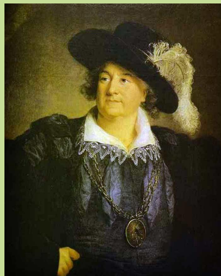
Ж. Б. Валлен-Деламот

Родился (12 февраля 1745г.) в семье дьякона Московской епархии. В 1755 году был принят в воспитанники гимназии при Московском университете, через год переведён из него в гимназию при Санкт-Петербургской академии наук и в 1758 году поступил в ученики Академии художеств к А. Ф. Кокоринову и Ж. Б. Валлен-Деламоту. Окончив в ней курс, с 1762 по 1768 год путешествовал за границей в качестве пенсионера Академии художеств, был в Париже, где учился у Ш. де Вайи и в Риме.