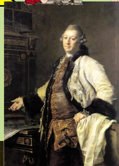
А. Ф. Кокоринов