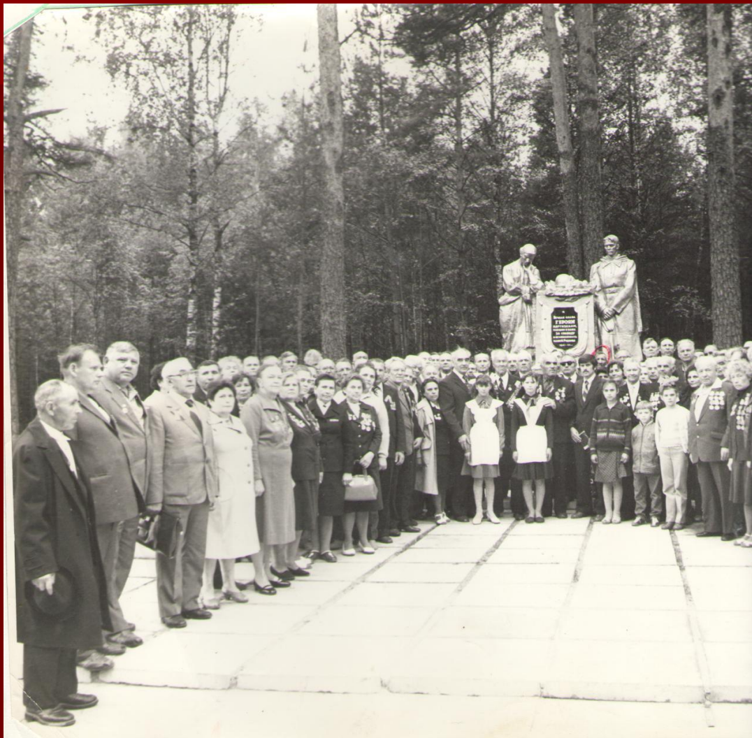
1984 год. Минская область. д. Усакино

Вечная слава ГЕРОЯМ партизанам, павшим в боях за свободу и независимость нашей Родины