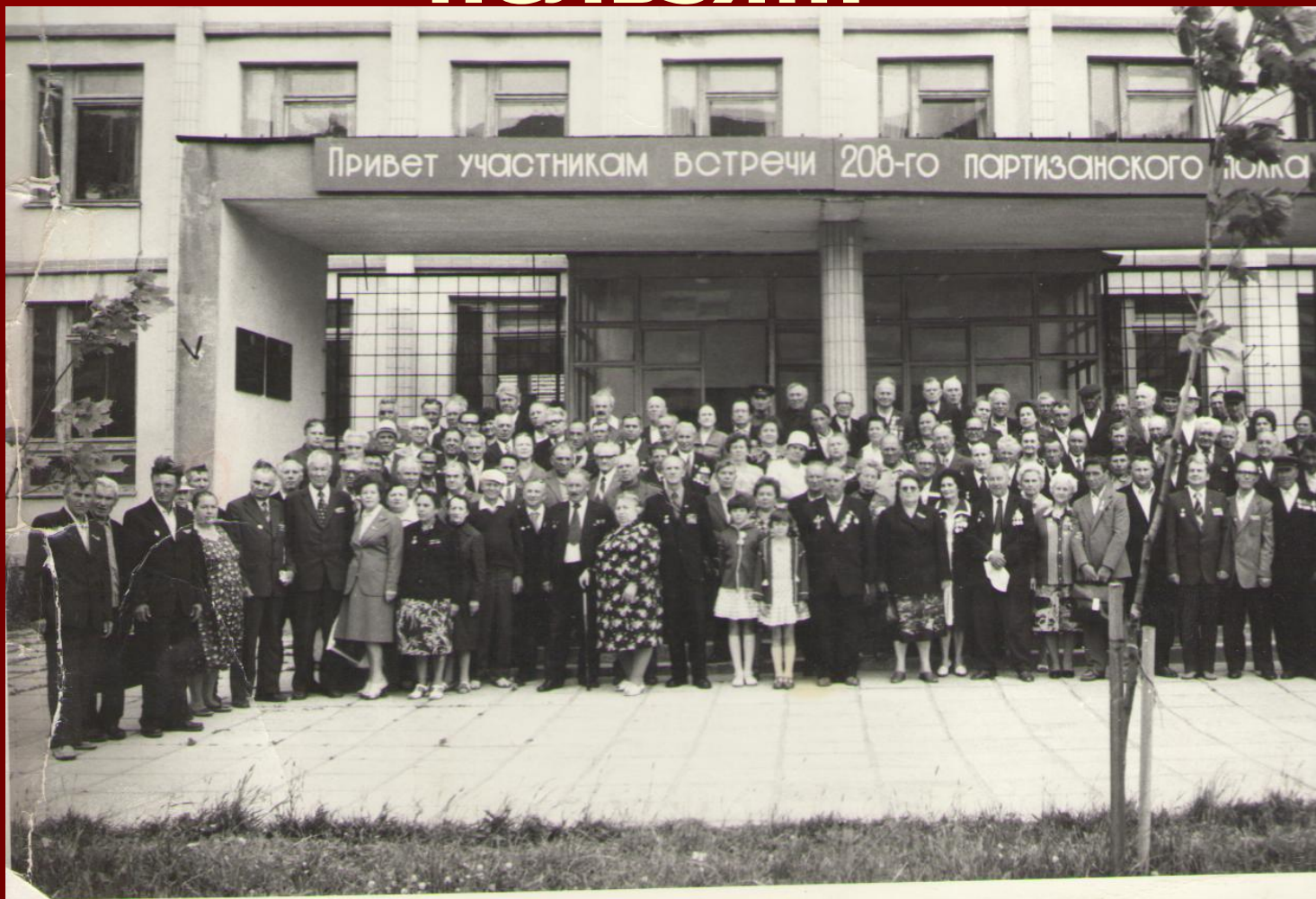
1984 год. г. Минск. Участники встречи 208-го партизанского полка (40 лет освобождения Белоруссии)