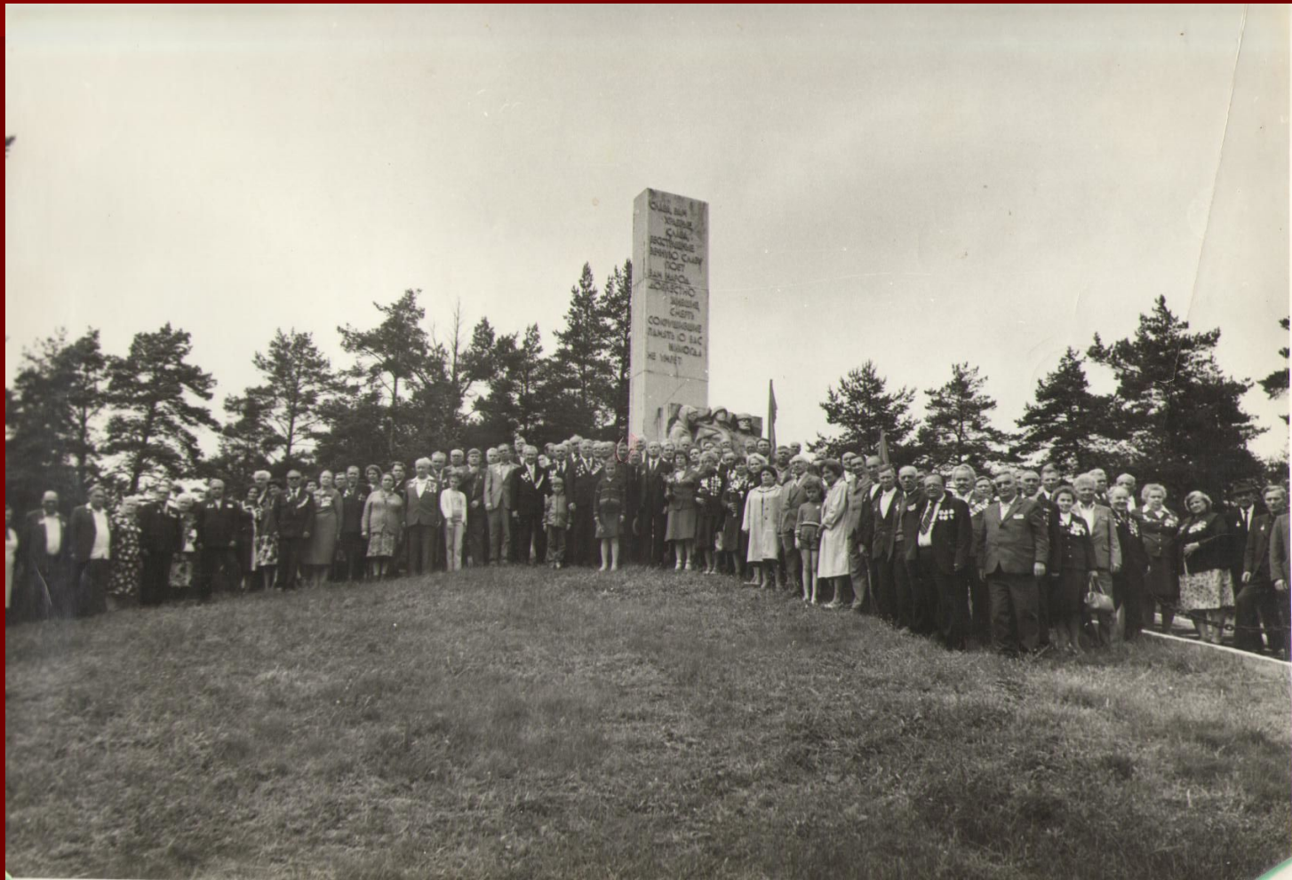
1984 год. Минская область. д. Кличев