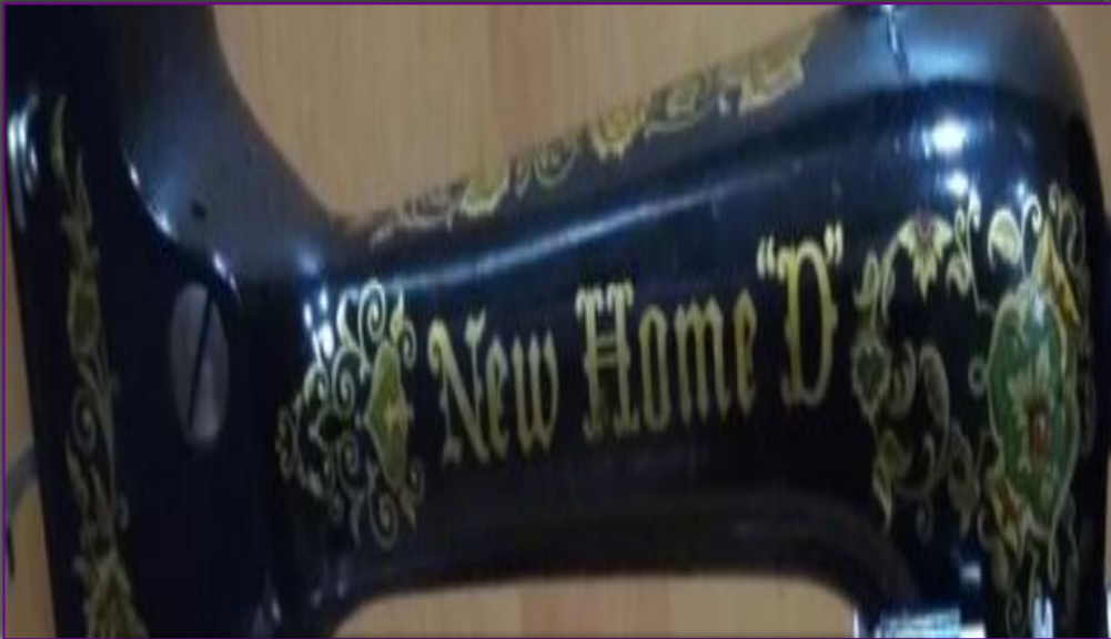
корпус машины с логотипом