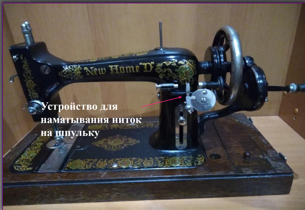
Устройство для наматывания ниток на шпульку