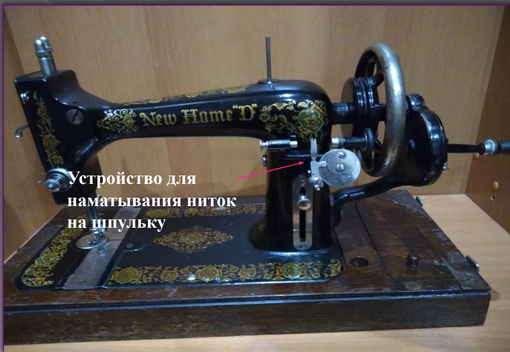
Устройство для наматывания ниток на шпульку