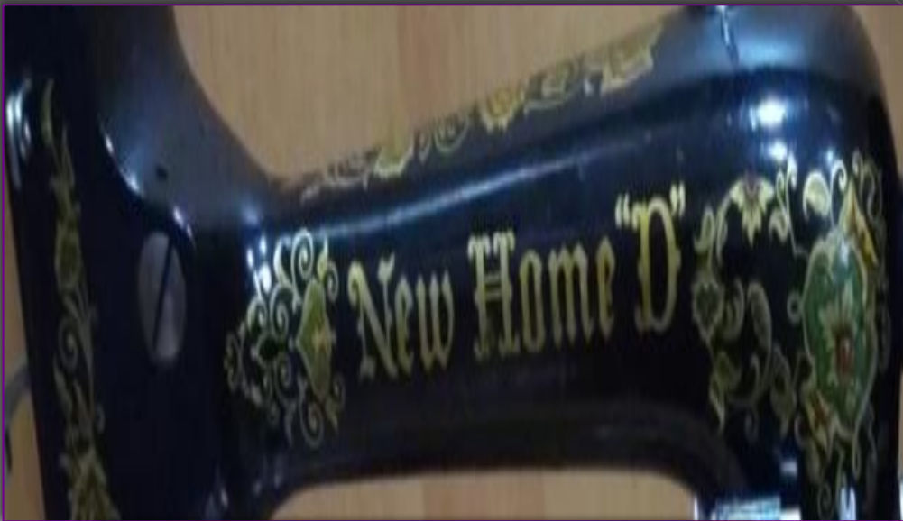
корпус машины с логотипом