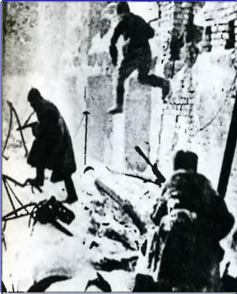
Сталинград. Сражение на улицах города