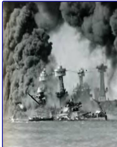
7 декабря 1941 года. После нападения на Пёрл-Харбор