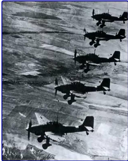
22 июня 1941 года. Немецкие бомбардировщики над советской территорией