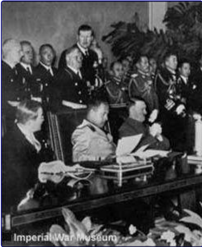
На подписании «Тройственного пакта»