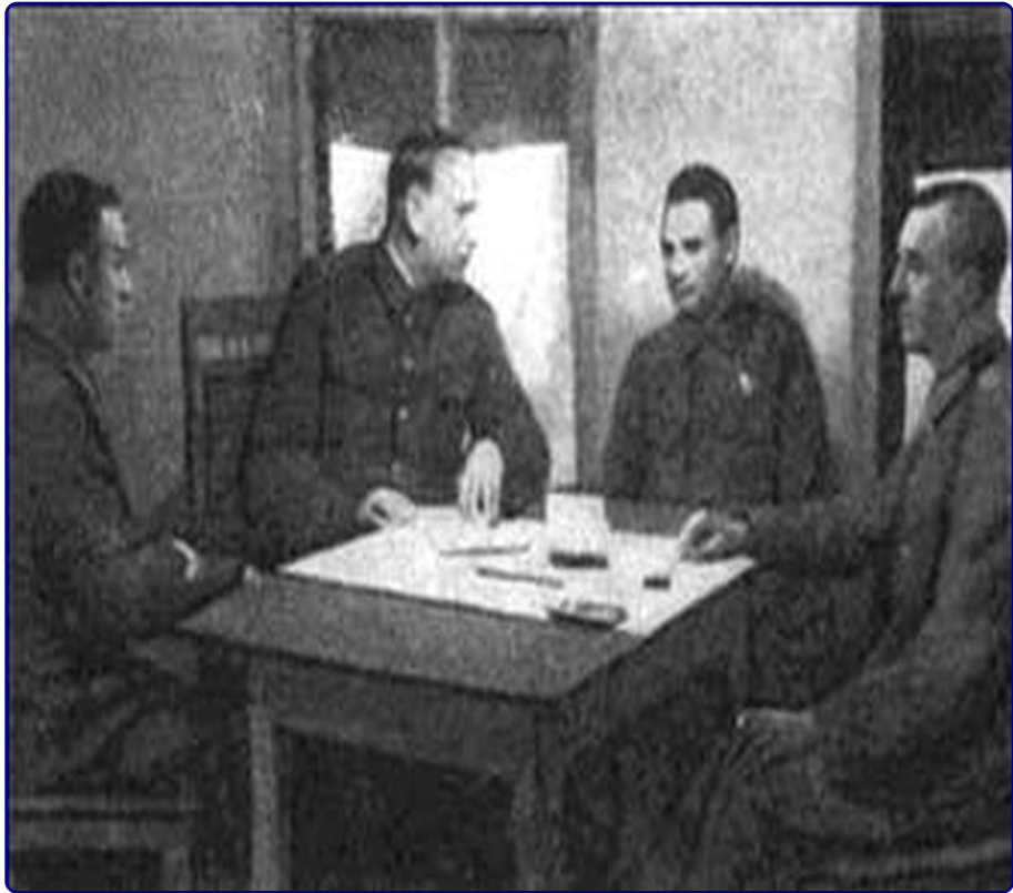
Допрос сдавшегося в плен фельдмаршала Паулюса