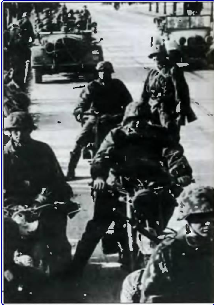
Немецкие мотоциклисты на улицах Белграда