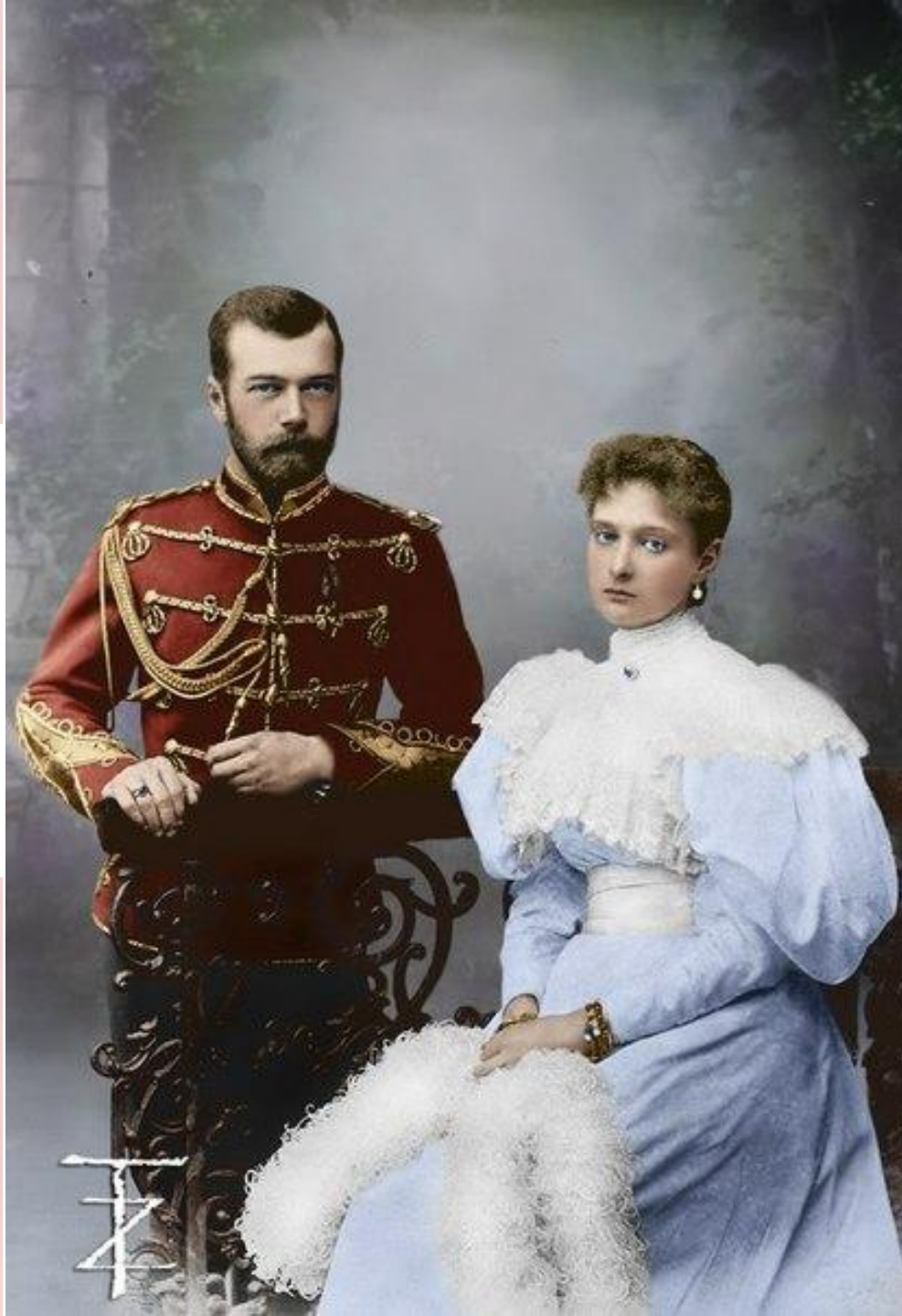
Александра Федоровна – Императрица