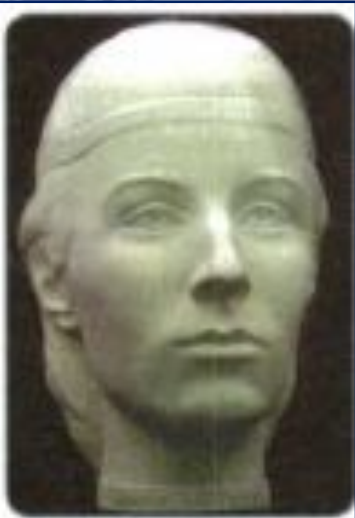
Елена Глинская. Реконструкция С. А. Никитина