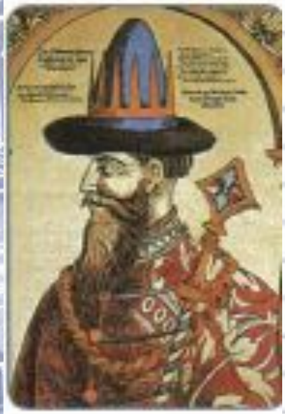
Иван IV, Гравюра XVI в.