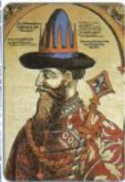
Иван IV, Гравюра XVI в.