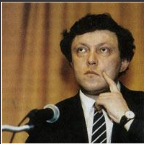
Г. Явлинский С. Шаталин