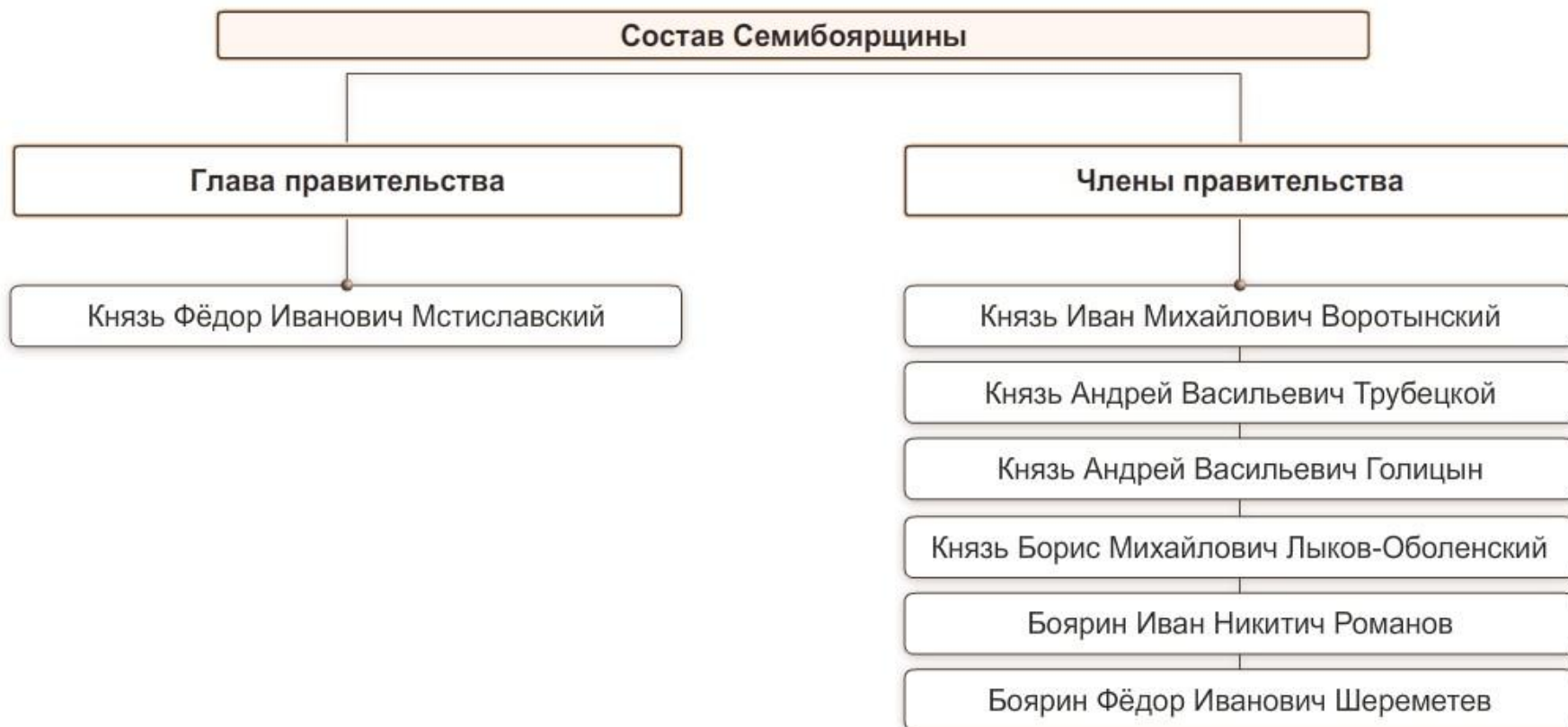
Схема «Состав Семибоярщины»