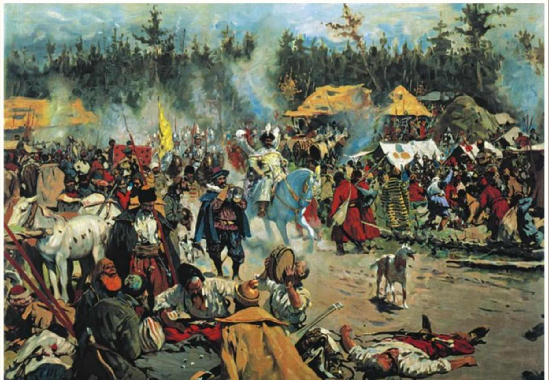
В Смутное время. Художник С. В. Иванов