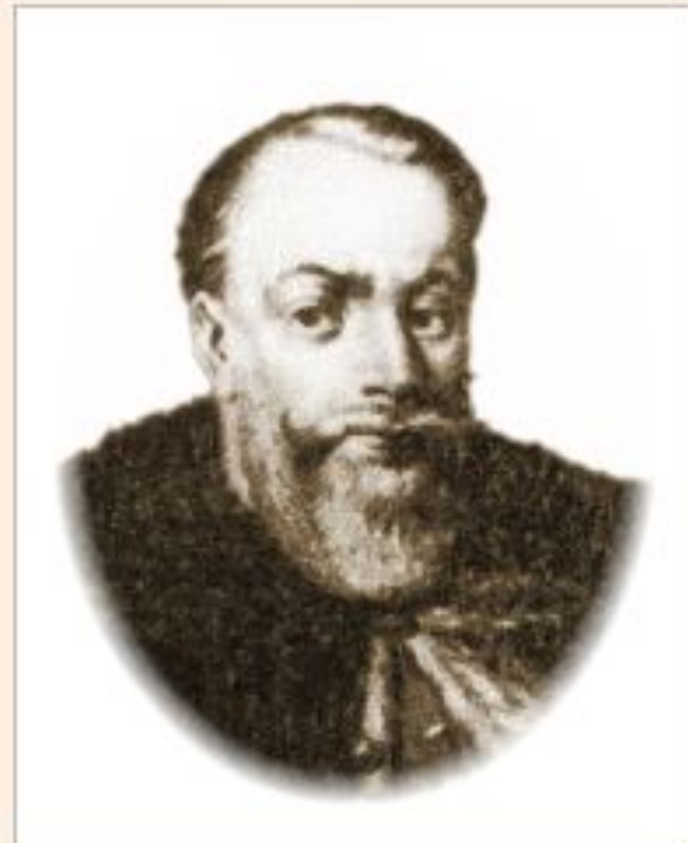
Ходкевич Ян Кароль (1560–1621)