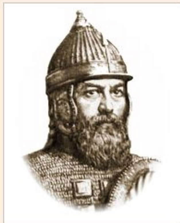
Пожарский Дмитрий (1578–1642)

Организатор и один из руководителей II ополчения в период Смутного времени