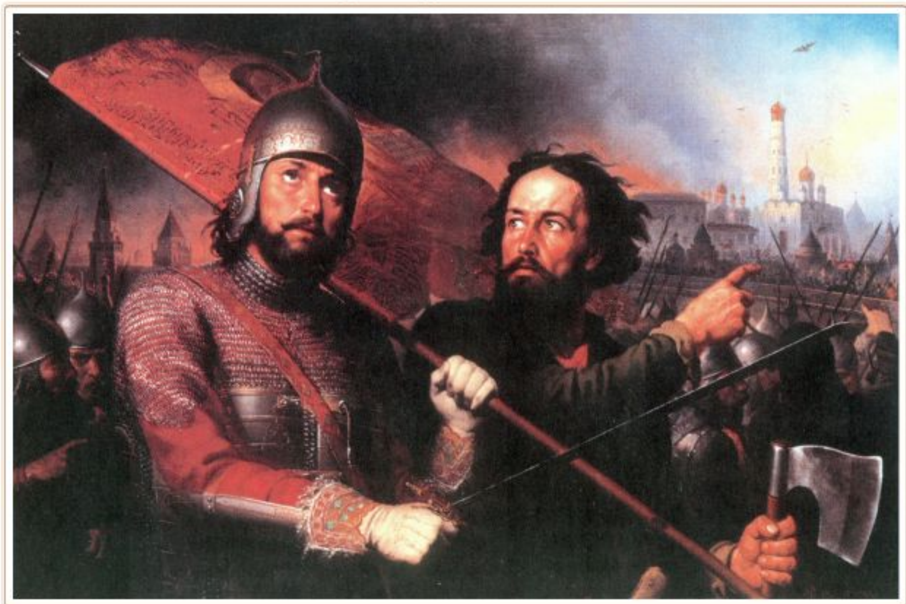
Минин и Пожарский. Художник М. И. Скотти, 1850 г.