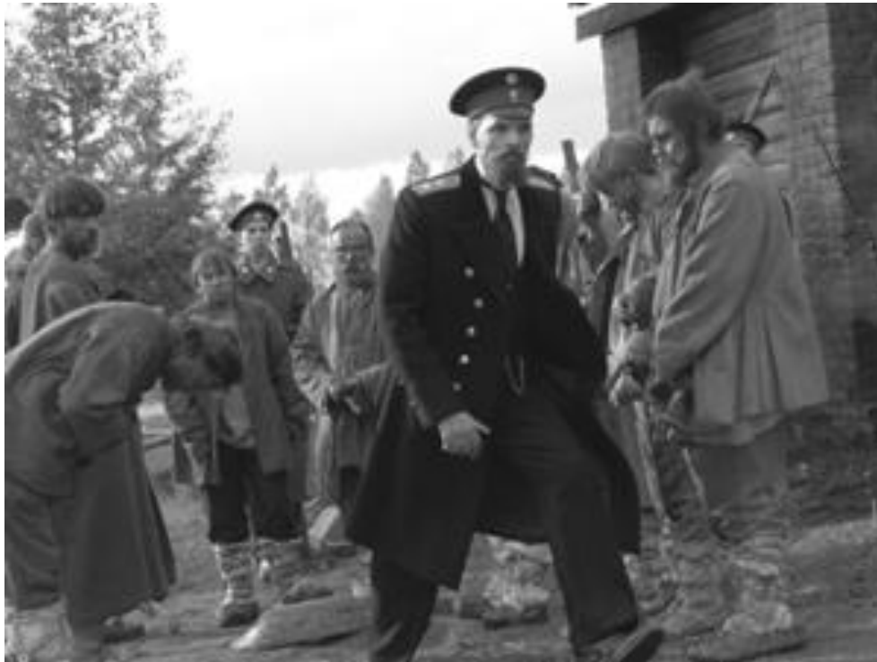
Столыпин осматривает хуторское хозяйство.

■ Но главной задачей реформы было стремление отвлечь крестьян от борьбы за захват помещичьих земель . Но выход неожиданно пошел в другом направлении. 60% вышедших из общины крестьян продали свои наделы . Численность хуторян к 1915 г. составляла 10%. Остальные крестьяне относились к ним с нескрываемой враждебностью