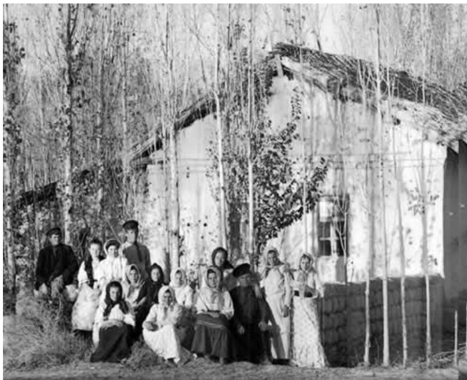
Русские переселенцы в Самаркандской губернии Туркестанского генерал-губернаторства.