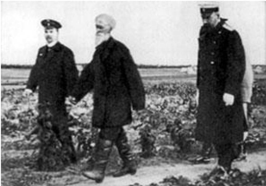
П.А.Столыпин осматривает хуторские огороды близ Москвы в апреле 1910 г