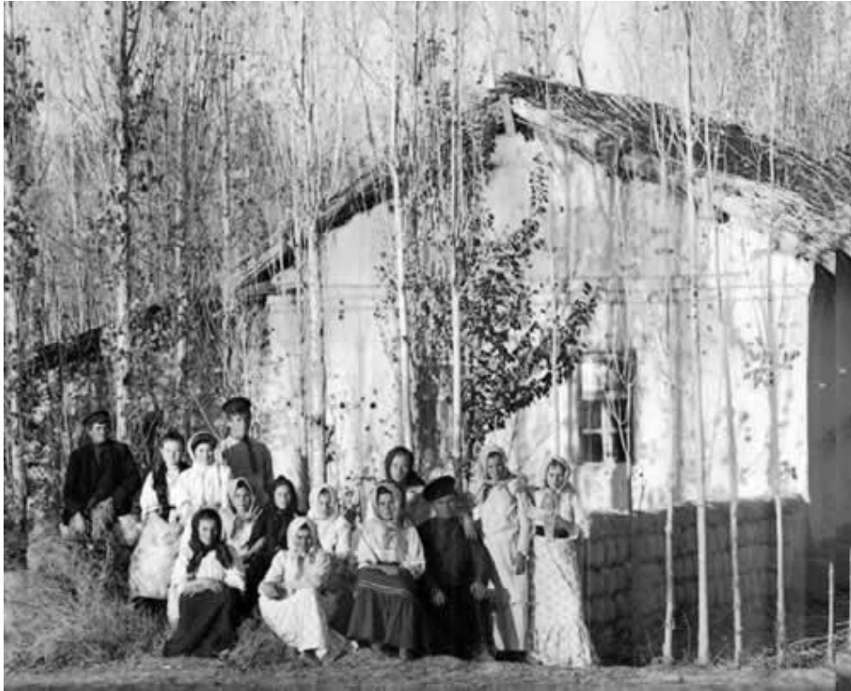
Русские переселенцы в Самаркандской губернии Туркестанского генерал-губернаторства.