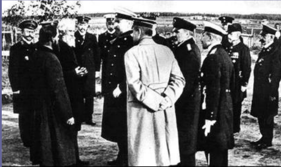
П Столыпин в гостях у кулака.