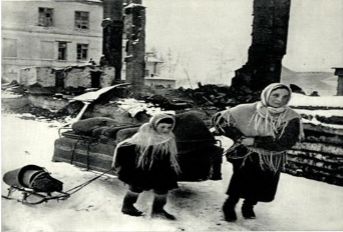
Надо искать новый хлеб...