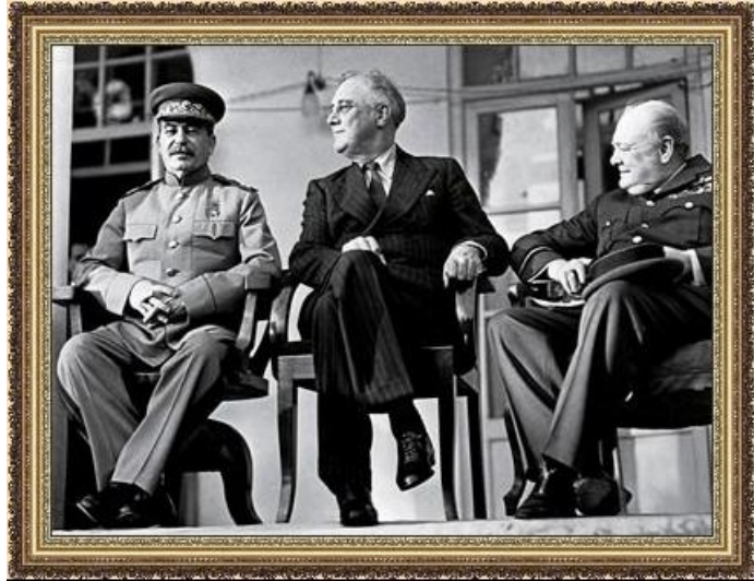
И. Сталин, Ф. Рузвельт, У. Черчилль в Тегеране

Лето - осень 1943 – Освобождены Смоленск, Гомель, Левобережная Украина, Киев.