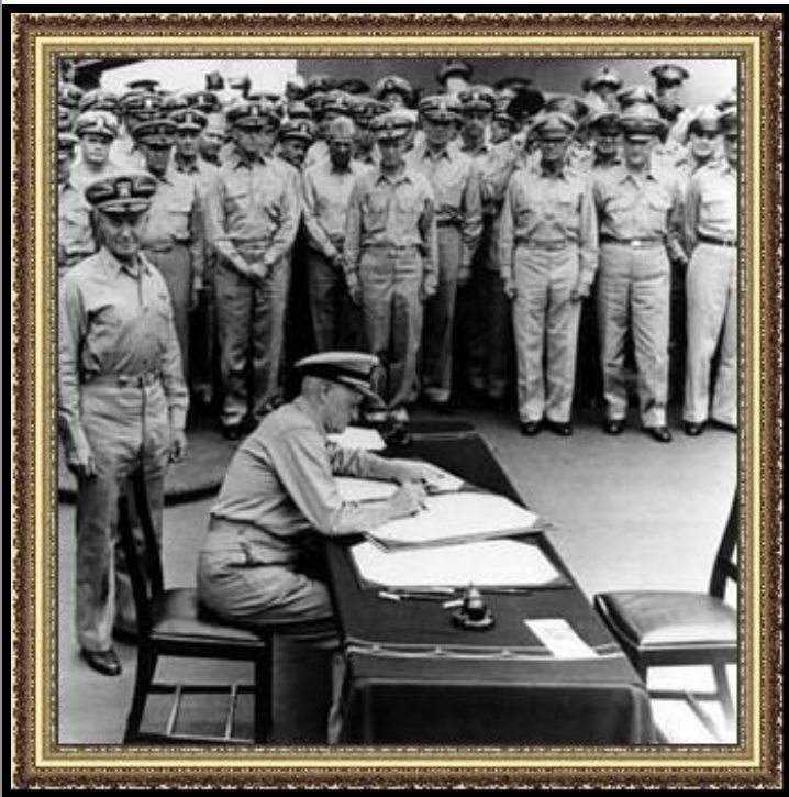
Подписание капитуляции Японии

1944 – Япония – захват территорий в Китае.