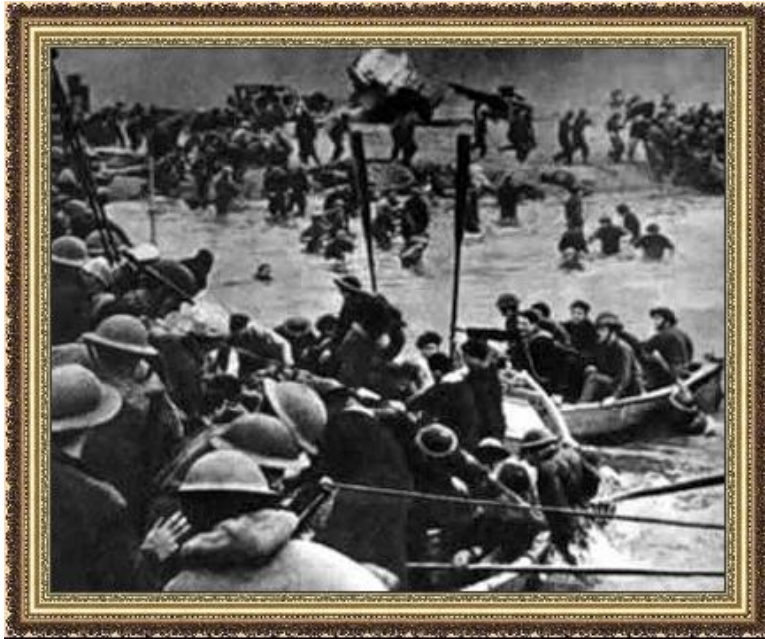
Эвакуация английской армии под Дюнкерком

«Странная война» Англия и Франция — трехкратное превосходство на западном фронте. Отказ от активных действий.