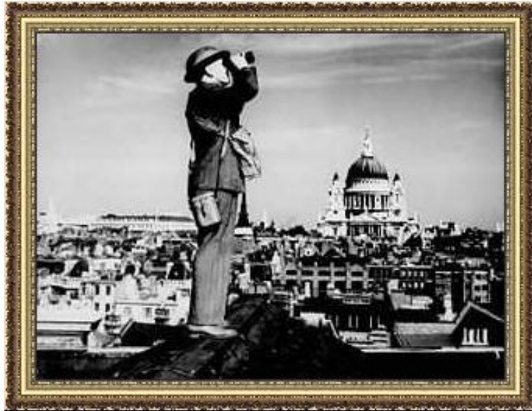
Солдат ПВО на крыше лондонского дома