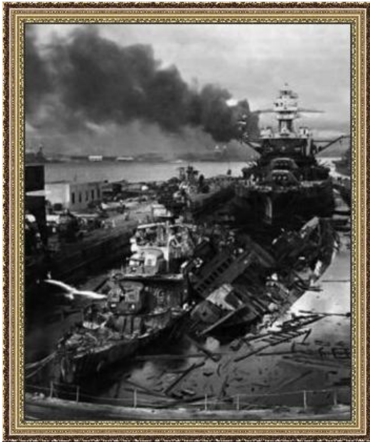
Американский авианосец после удара японской авиации

22.06.1941 - нападение Германии на СССР. Начало нового этапа войны.