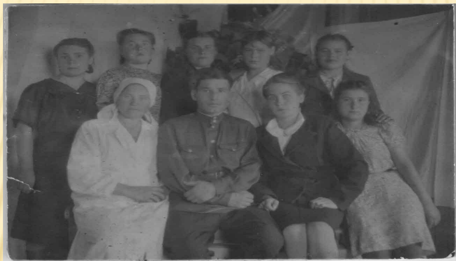
Сотрудники детского санатория 10.01.1948